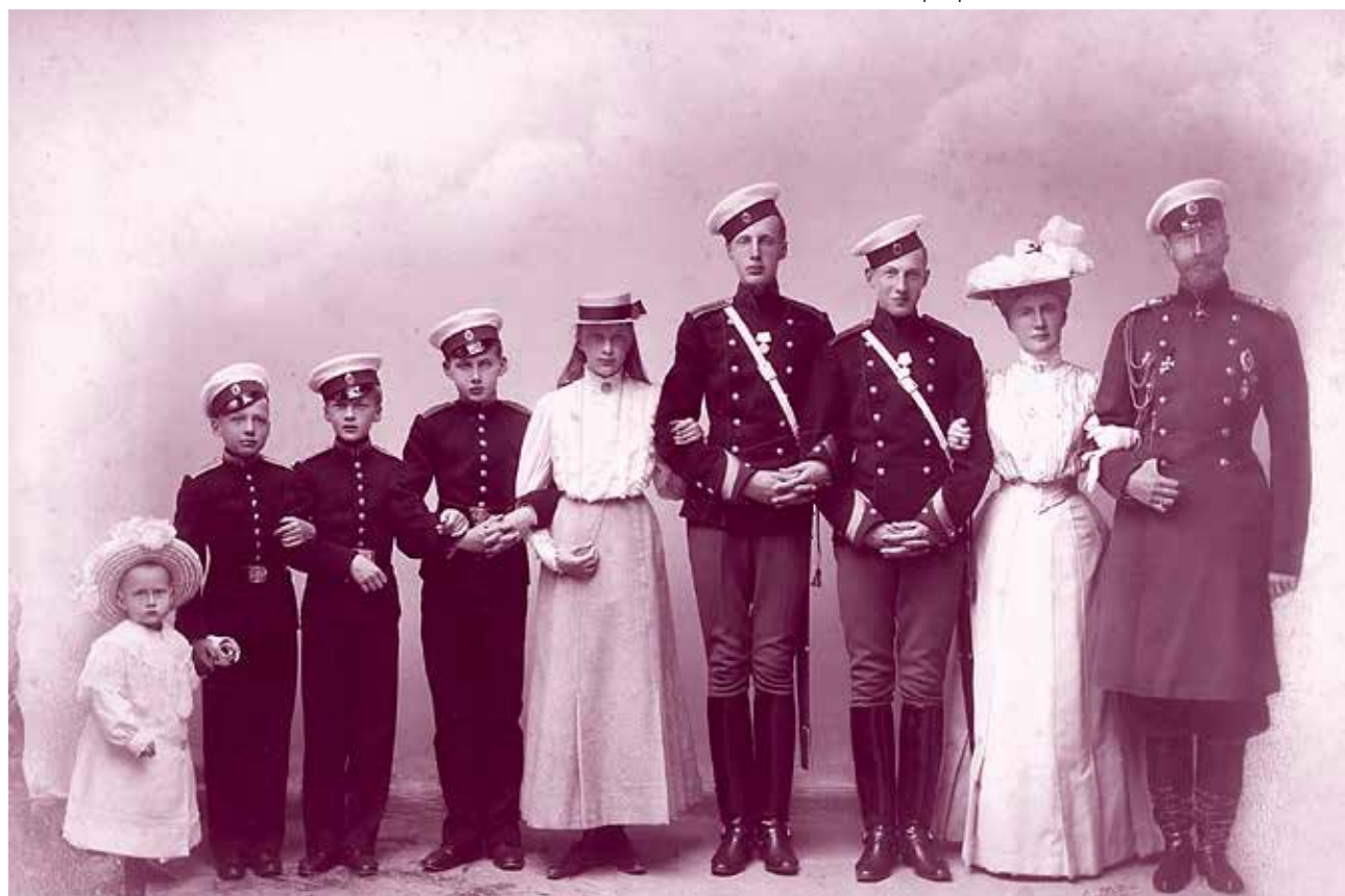
Семья вел. кн. Константина Константиновича в Библиотеке Марии Федоровны.