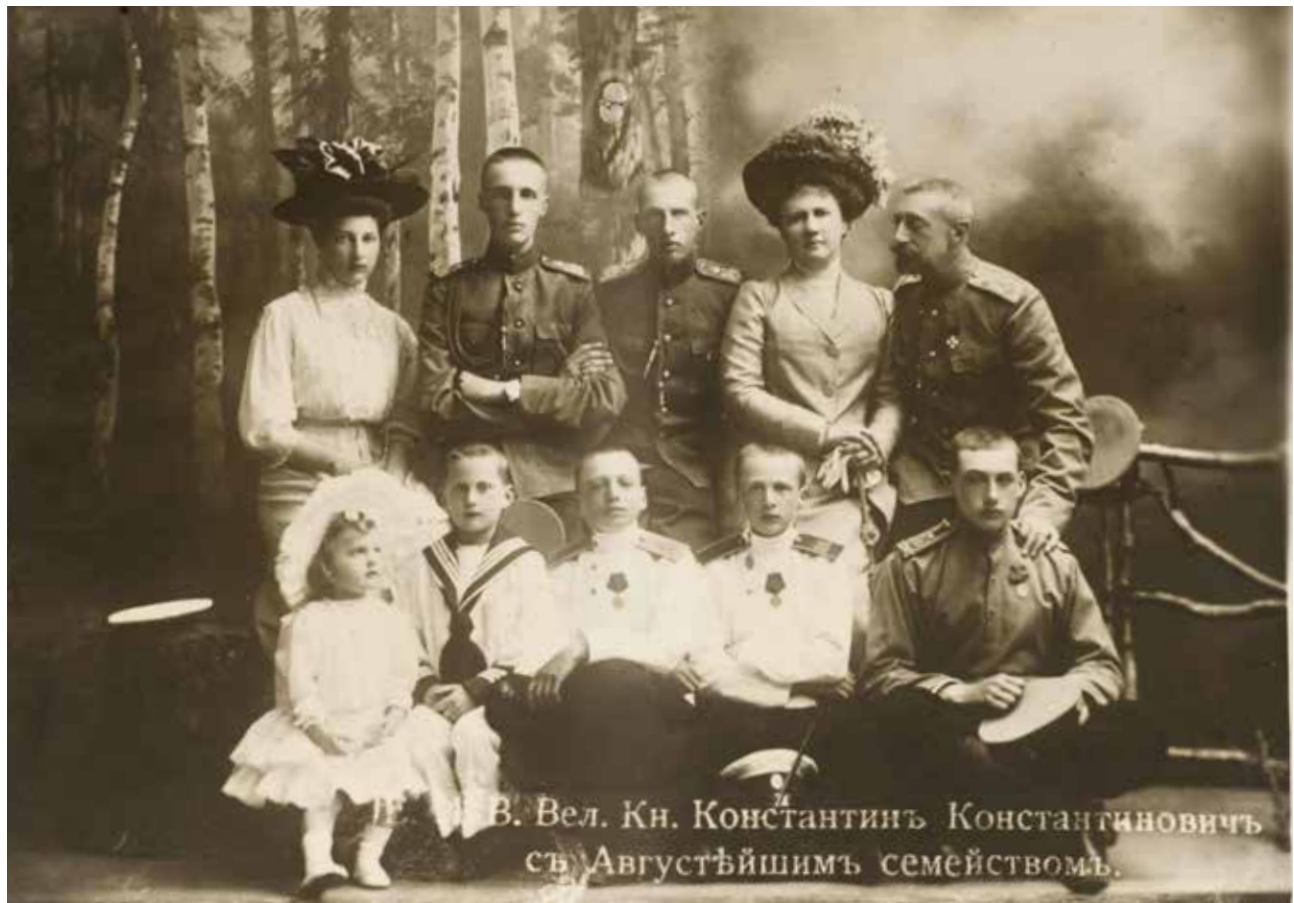
В. Вел. Кн. Константинъ Константиновичъ съ Августѣйшимъ семействомъ.

Павловск был любимым местом не только Константина Константиновича, но и многих членов его семьи. В Павловске часто гостила сестра Константина Константиновича Ольга, королева Греческая. И в Павловске 10 августа 1888 года родился ее младший сын