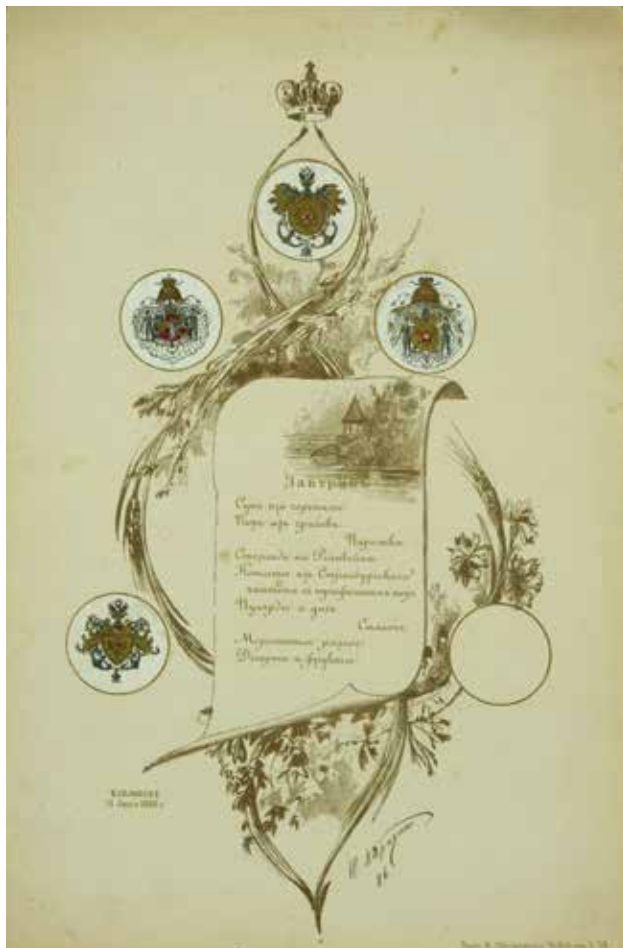
Меню на крещение князя Иоанна Константиновича. 11 июня 1886 г. ГМЗ «Павловск»

принц Греческий и датский Христофор. В честь этого события 11 августа 1888 г. в Павловском дворце был дан праздничный завтрак. В 2009 году в коллекцию Государственного музея-заповедника «Павловск» было приобретено из частной коллекции меню того завтрака, выполненное по рисунку художника Н.Г. Богданова. В верхней части меню изображен Павловский дворец, чуть ниже в двух медальонах вид Красной площади с собором Василия Блаженного и Спасской башни в Москве и видом Акрополя в Афинах. Ольга Константиновна родилась в Павловске и обязательно его посещала при каждом приезде в Россию. Павловск для нее был родными пенатами, куда ее постоянно влекло и в мыслях, и в реальности. В Павловске она была дома, где могла общаться со своим любимым братом Константином, с которым её связывала тесная дружба и не только кровное родство, но и духовное. Они тонко чувствовали друг друга. Она писала Константину Константиновичу, что в Греции ей все близко и знакомо, потому что она родилась и выросла в Павловске, который дышит образами древней Эллады. 3