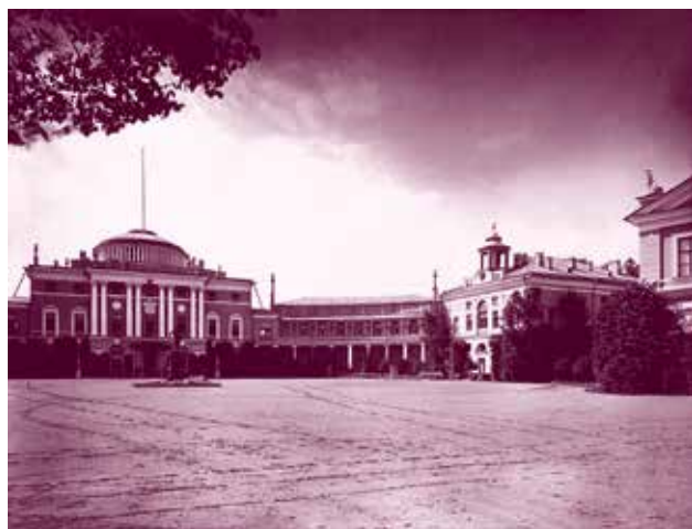
Вид на Павловский дворец сос тороны Павлаца. 1905.

Именно в Павловске проходили наиболее теплые и памятные семейные торжества. Здесь родились трое из его девяти детей – Иоанн Константинович 23 июня 1886, Гавриил Константинович 3 июля 1887 года, Вера Константиновна 11 апреля 1906 года. В своих дневниках Константин Константинович подробно описывал рождение и крестины в Павловске своего первенца князя императорской крови Иоанна Константиновича. Крестины Иоанна состоялись 11 июля в церкви Павловского дворца. Иоанн родился великим князем, но вскоре был перетитулован в князя императорской крови по-новому «Учреждению об императорской фамилии», утвержденному 2 июля 1886 года специально в связи с рождением сына у Великого князя Константина Константиновича. Так как то были первые крестины князя императорской крови, то церемония крестин была утверждена самим императором Алек-