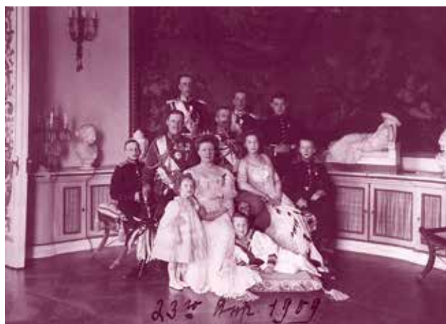
Семья вел.кн. Константина Константиновича в Библиотеке Марии Федоровны.