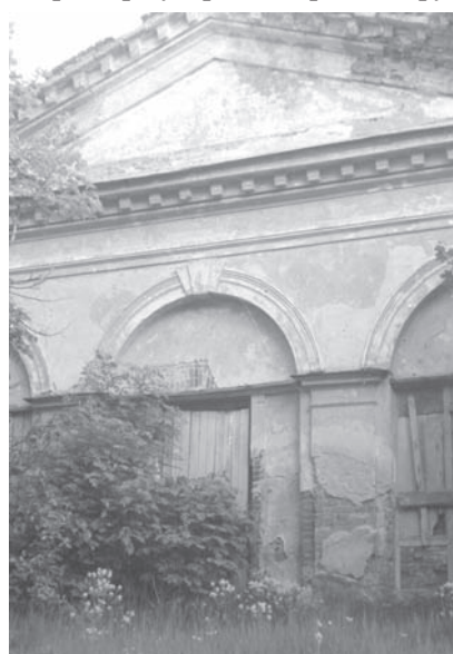
Фасад бывшего здания конюшни.

При М. Г. Головкине недалеко от деревянного петровского дворца появился большой каменный дворец с регулярным парком и прудами.