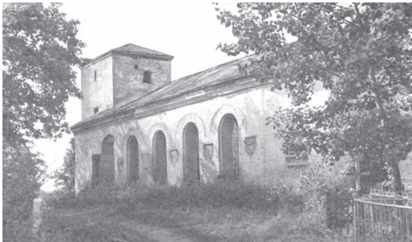
Церковь на Княжьей горке. Фото 1971 г.

Восточная, алтарная, часть ропшинской церкви — пятигранная, она освещена двумя арочными окнами. Нижнюю половину каждого окна закрывала выкованная из железа фигурная решетка, с четырьмя кольцами в центре каждого звена. На сохранившихся решетках выкованы изображения ло-