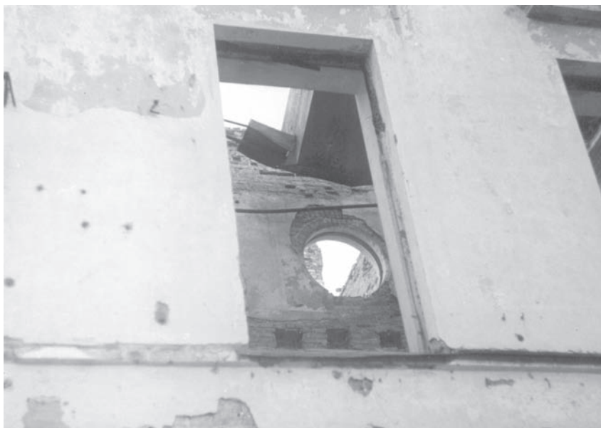
Стена бывшего парадного Голубого зала.

С восточной стороны дворца был заложен Нижний парк, который, как и Верхний сад в Петергофе, был регулярным, партерным, прямоугольным. Открытое пространство сада раскрывало панораму всего протяженного фасада здания. Главная аллея была ориентирована на центр дворца. Вся территорию разбили на 12 квадратов, возможно, по аналогии с Новым садом в Царском Селе, который создавался в то же время паркостроителем Н. Жираром. Это позво-