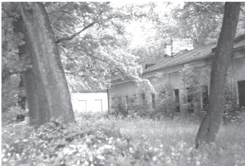
Бывший Большой гостиный флигель дворца.

Шумахер утверждал, что ранним утром 4 июля лейтенант князь Ф. С. Бяратинский прибыл в Петербург и передал сообщение обергофмейстеру Н. И. Панину, что император мертв. Но об этом никому, кроме Екатерины, Панин не сообщил.