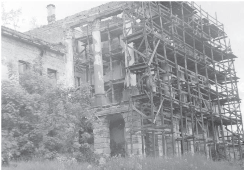
Фасад Ропшинского дворца со стороны Нижнего парка.

Каждое лето я приезжаю в Ропшу на каникулы, и с каждым годом становится все страшнее, что