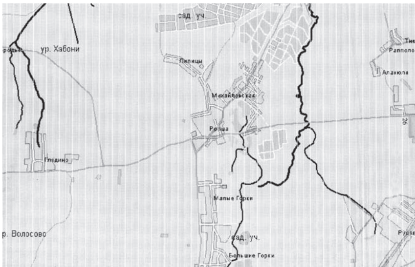
Ропша и ее окрестности

Поселок вытянулся более чем на километр вдоль шоссе из Стрельны в Кипень. Это бывший средневековый Нарвский тракт, соединявший торговый город Невское Устье**, находившийся при впадении реки Охты в Неву, с Нарвой.