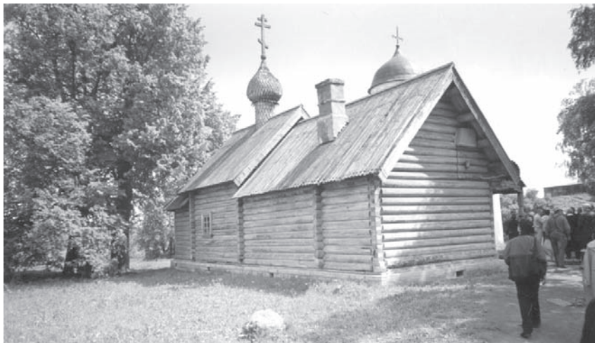
Старая Ладога. Церковь Св. Дмитрия Солунского. 2003 г.

Прошедшая конференция — еще один важный шаг к познанию нами своей истории. Знать прошлое Ладоги означает немного приблизиться к пониманию и истории Петербурга. Ведь именно из Ладоги Петр I начал свой военный поход в Приневье, туда, где зародилась столица Российской империи — Петербург.