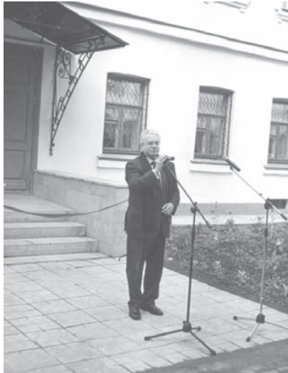
Директор Государственного Эрмитажа М. Б. Пиотровский. 2003 г.