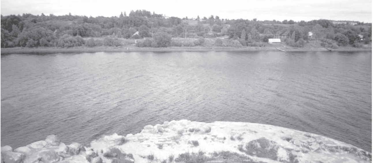
Вид р. Волхова с крепостной стены Старой Ладоги. 2003 г.

Почти все участники конференции выступали блестяще. Без сомнения, интеллектуальный потен-