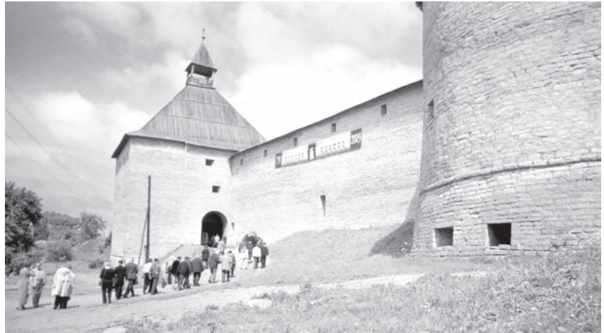
Участники конференции направляются к месту раскопок в Старой Ладоге. 30 июня 2003 г.

30 июня — 2 июля 2003 года в Старой Ладоге под эгидой ЮНЕСКО прошла международная научно-прак-