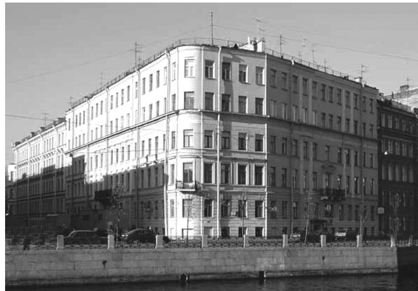
Набережная Фонтанки, 19

Э тот дом, стоящий на пересечении набережной Фонтанки и Итальянской улицы, относящийся к так называемой рядовой застройке, не включен ни в свод памятников истории и культуры Санкт-Петербурга, состоящих под охраной государства, ни в число вновь выявленных объектов КГИОП. Но это не означает, что в его истории не было ничего интересного и поучительного. С ним связаны первые десять лет существования некрасовского журнала «Современник».