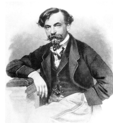
И. И. Панаев

Вскоре он письменно известил Белинского о договоренности с владельцем «Современника» П. А. Плетневым об аренде этого журнала и предложил Белинскому передать в портфель будущего журнала материалы задуманного им альманаха, на что Белинский тотчас же согласился [17, т. 13, кн. 1, с. 355]. Договор И. И. Панаева с П. А. Плетневым об аренде «Современника» сроком на пять лет был официально подписан 23 октября 1846 г. [17, т. 14, кн. 1, с. 263].