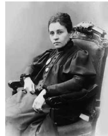
П. А. Стрепетова

С декабря 1881 до конца 1882 г. в этом доме проживала великая трагическая актриса Пелагея Антипьевна Стрепетова [23, с. 843]. Стрепетова дебютировала 11 декабря 1881 года в «Горькой судьбине» А. Ф. Писемского. Успех превзошел ожидания. Газеты сообщили, что появление Стрепетовой вызвало «гром рукоплесканий, крики, махание платками, удовлетворительное, радостное выступающее за край чувство массы зрителей, настоящую шумную, торжествующую овацию» [4, с. 179].