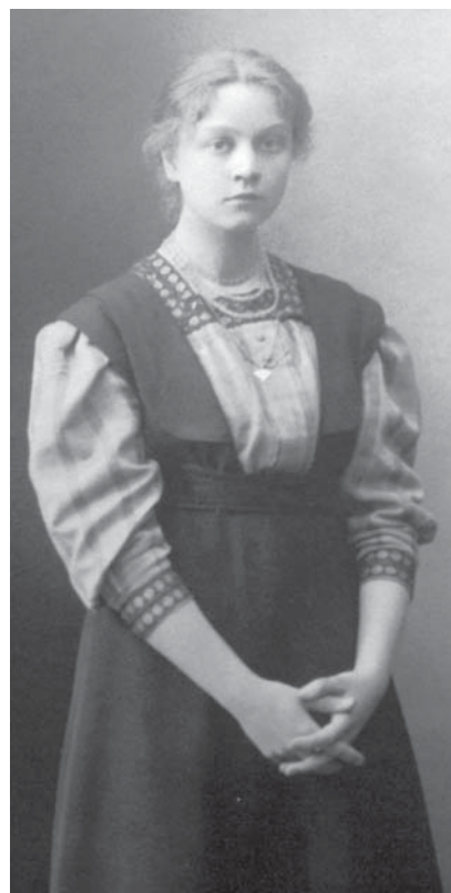
К. Тревер. Бестужевские курсы. 1910 г.