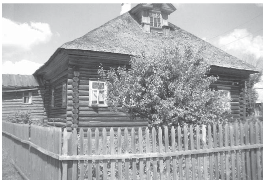
Родной дом в Коровново