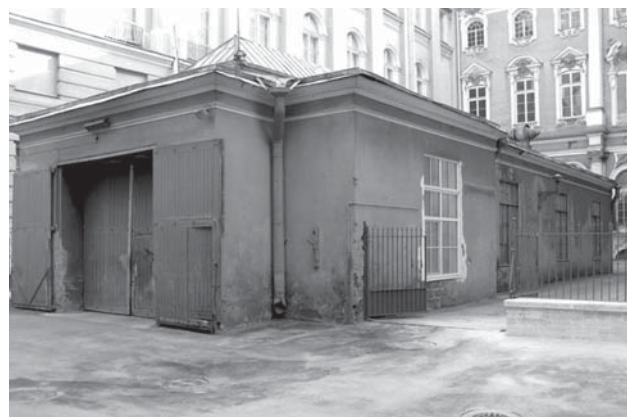
Гараж. Современное фото