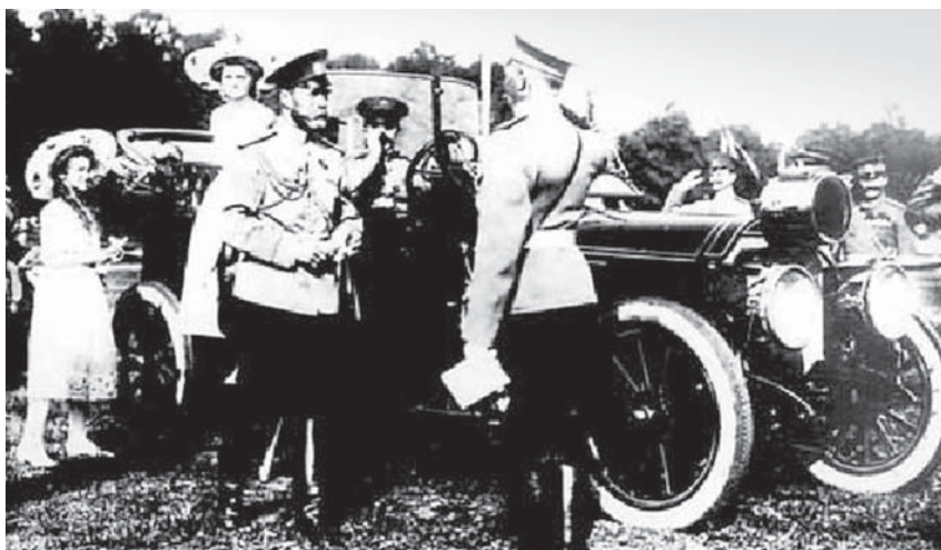
Николай II у автомобиля «мерседес бенц»