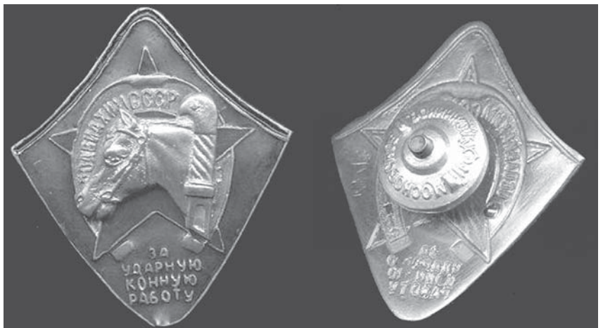
Знак «За ударную конную работу» 1934 г. Им награждались члены Осоавиахима, прошедшие начальную кавалерийскую подготовку и научившиеся бережному уходу за конем