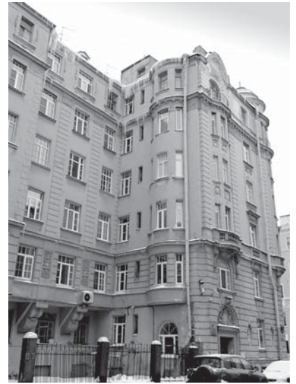
7-я Советская ул., д. 21

Свободу для творческих поисков в атмосфере острой и противоречивой борьбы архитектурных идей предоставляли архитектурные конкурсы, приобретшие особую популярность в начале XX века. Еще в период обучения в Высшем художественном училище при