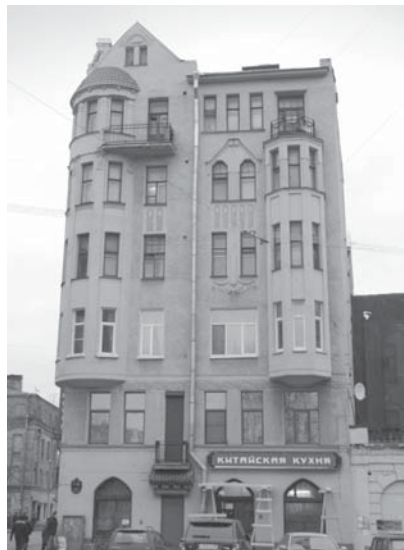
Чкаловский пр., д. 5

ектом претерпела и соседняя часть фасада. Осуществленный в натуре вариант намного экспрессивнее проектного. Появился гладкий щипец с асимметрично расположенным эркером, который перетекает на соседний узкий фасад, выходящий на Пионерскую ул., «прорастая» здесь балконом. Эта угловая часть наиболее близка исканиям северного модерна. Врезанный в угол дома башнеобразный эркер, щипцы соседних фасадов, балкон – все это стянуто в один объемно-пластический узел. О северном модерне повествует и характерный для этого архитектурного направления декор: взбирающаяся по стене ящерица, плавающие среди водорослей рыбы. Из-под черепичной крыши башенки-эркера выглядывают мордочки то ли собак, то ли волков. Такие же звери высовываются из стены над окнами второго этажа на фасадах, смотрящих на Малую Разночинную ул. и Чкаловский пр. «Северные» мотивы лишь слегка оттеняются тонкой «южной» полосой греческого меандра, обвивающего угловой эркер. (Интересно, что вскоре после завершения строительства в 16-й квартире этого дома некоторое время жил автор – П. П. Светлицкий 14 .)