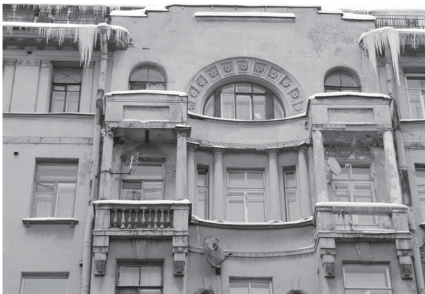
Ленина, д. 19. Фасад

расположение рельефов в точках наибольшего напряжения конструкций – характерный признак модерна. Центральная ордерная композиция, оживляя фасадную композицию, не определяет масштабный строй здания. Дробно расчлененную плоскость фасада объединяют скорее ритмично расположенные трехэтажные аркеры – «ордер эклектической архитектуры» 15 .