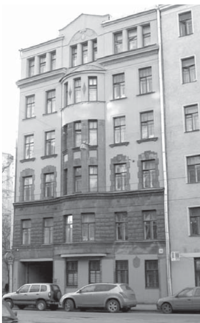
Гаванская ул., д. 30