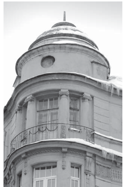
7-я Советская ул., д. 21. Деталь фасада