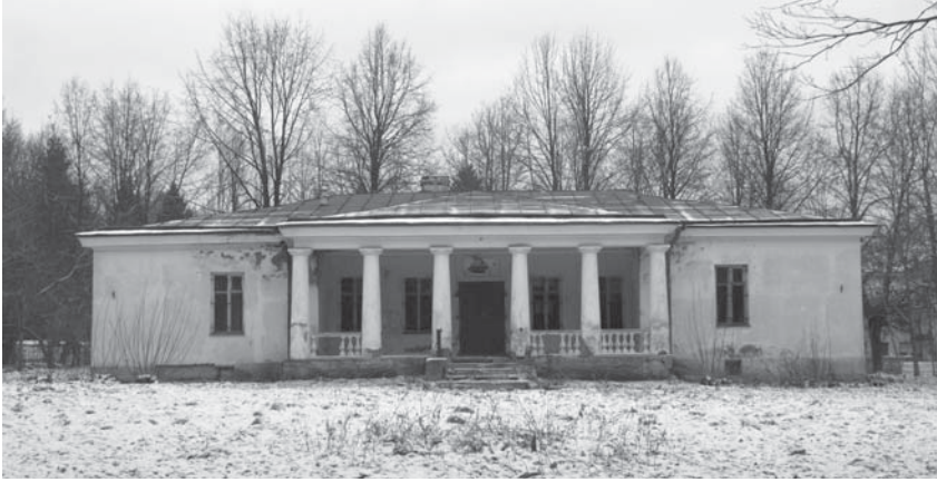
Ясли-детский сад на территории Пулковской обсерватории

На территории обсерватории в период с 1947 по 1953 год построили также детские ясли и сад, территории которых ограждены металлической решеткой с изображением стилизованных