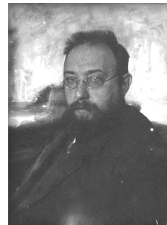
Владимир Дмитриевич Бонч-Бруевич

За послеоктябрьский период издательством было выпущено 70 названий книг, преимущественно по общественным вопросам.