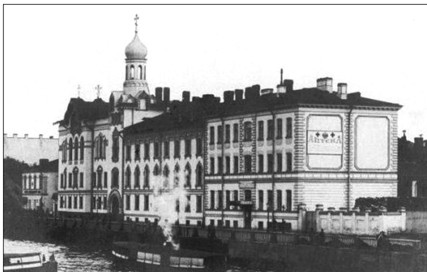
Крестовоздвиженская община сестер милосердия

и церковь того же посвящения при Николаевском женском училище (дом во имя Великомученицы Варвары в Фонтанном доме). В 1918 году стала приходской и в 1922 году закрыта церковь во имя Св. Благоверного князя Александра Невского при Александровской больнице для чернорабочих (дом 132). В 1919 году стала приходской, окончательно закрыта в 1928 году и в середине 1930-х годов снесена церковь во имя Воскресения Христова (территория дома 59). В марте 1921 года была закрыта с приспособлением ее помещений под клуб церковь во имя Сретенья Господня Александро-Невского резервного батальона (дом 90), в 1922 – 1923 годах – церковь во имя Св. Андрея Критского при Экспедиции заготовления государственных бумаг, окончательно закрыты церковь во имя иконы Божией Матери Всех скорбящих Радости при Обуховской мужской больнице и церковь того же посвящения при Калинкинской больнице, церковь при Крестовоздвиженской общине сестер милосердия (дом 154). В эти годы были уничтожены многочисленные часовни, приписанные к закрытым церквям, домовые церкви в частных домах и особняках 1 .