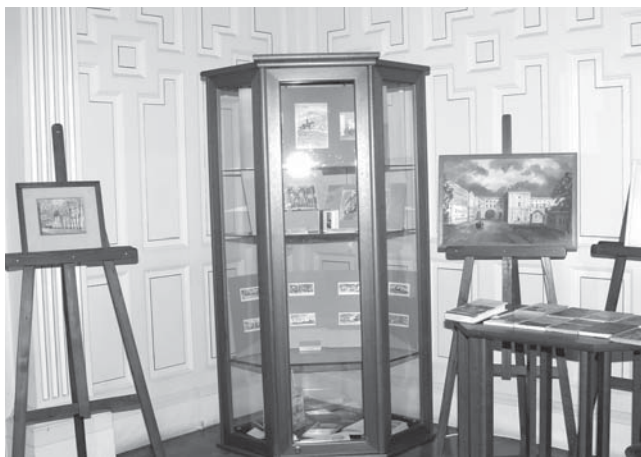
Фрагмент выставки, посвященной творчеству Ю. М. Игнатъева, в Белом зале Дома Бажанова, ул. Марата, д. 72. 2009 г.