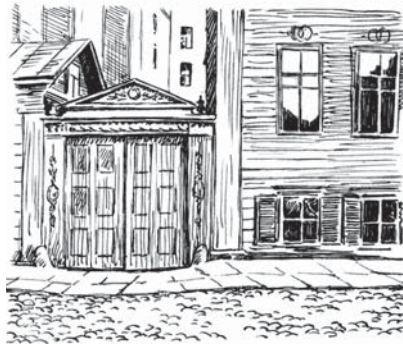
Иллюстрации к сборнику повестей и рассказов Ф. М. Достоевского