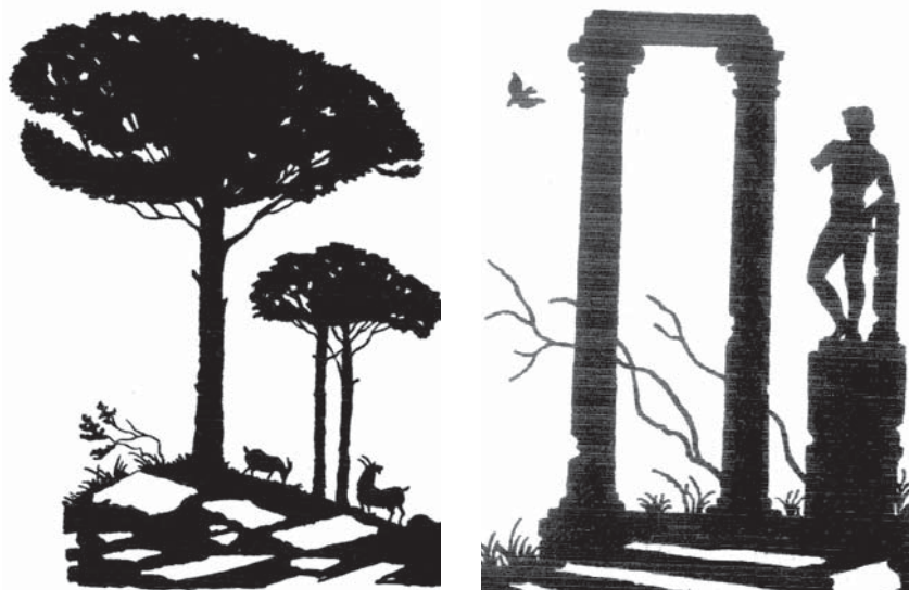
Иллюстрации к сборнику стихов Е. А. Баратынского