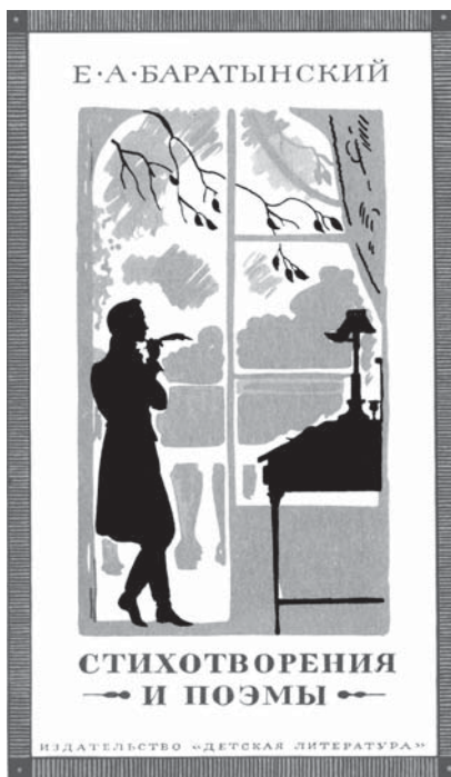
Обложка к сборнику стихов Е. А. Баратынского

Впервые на выставке «Из книг Ю. Игнатъева» в Детской библиотеке истории и культуры Петербурга на Марата, 72 были по возможности полно представлены оригиналы иллюстраций художника! И только