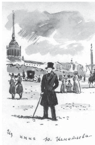
Экслибрис Ю. М. Игнатьева (наст. размер 8,5 x 12 см)

В начале сентября 1999 года в Сокольниках в Москве состоялась юбилейная книжная выставка, на которой была и наша книга – к тому времени единственный изданный в юбилейном году «Евгений Онегин».