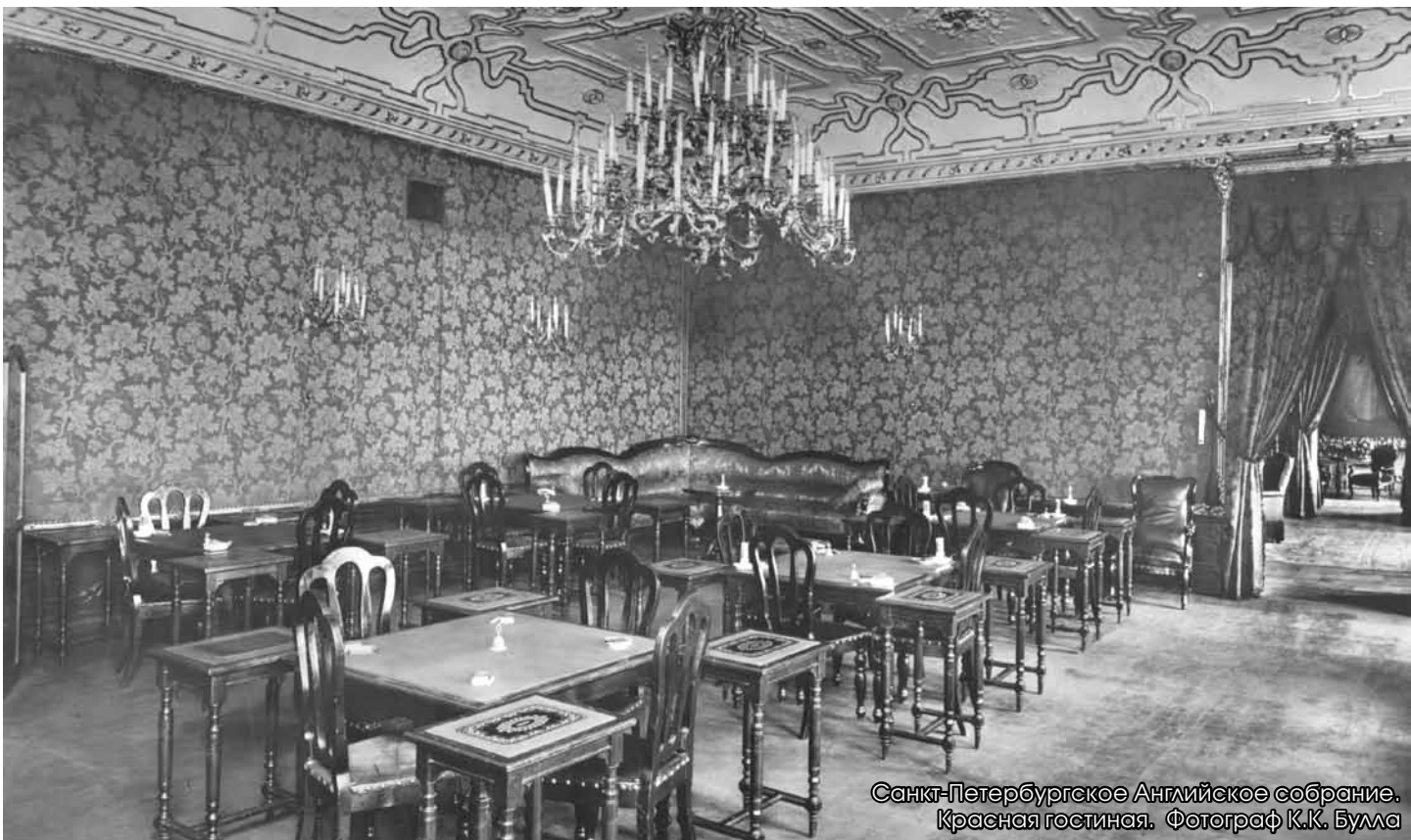
Санкт-Петербургское Английское собрание. Красная гостиная.