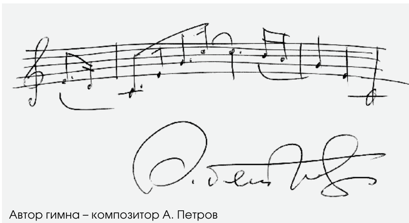
Автор гимна – композитор А. Петров

Два с половиной века назад члены собрания устраивали обеды два или три раза в неделю, но непременно по средам и субботам. Сегодня жесткого расписания нет. Несколько раз в год проходят клубные ассамблеи, в остальное время его участники встречаются по случаю культурных событий, проходящих несколько раз в