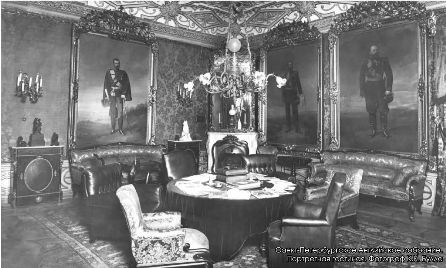
Санкт-Петербургское Английское собрание. Портретная гостиная.