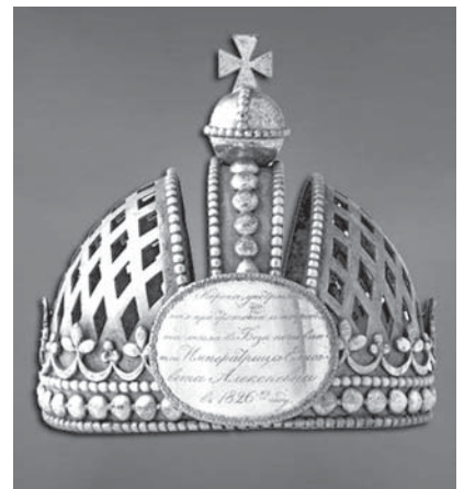
Погребальная корона Елизаветы Алексеевны

Пока тело умершей с подобающими почестями медленно направлялось по последнему пути, в Петербурге готовилась Печальная церемо-