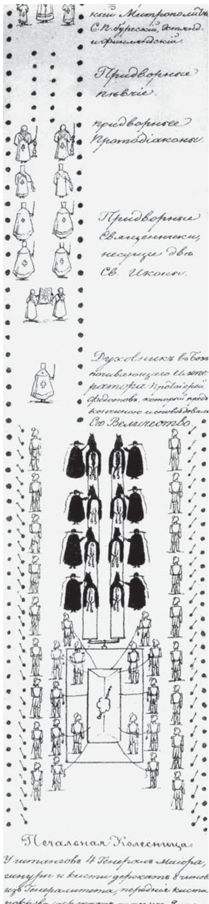
Печальный кортеж императрицы Елизаветы Алексеевны

короны – одна для несения на гробе, другая полагалась для надевания на голову усопшей императрицы. В шествии участвовала карета покойной императрицы Елизаветы Алексеевны, в которой везли корону. Шествие чинно следовало из Белева через Торжок, Вышний Волочек, Чудово, Тосно к Санкт-Петербургу. При остановках на ночлег корону и покров снимали с гроба, гроб устанавливали в церкви того места, где делали остановку. При панихидах в местах прохода Печального кортежа гроб заносили в церковь, корону при этом снимали с гроба.