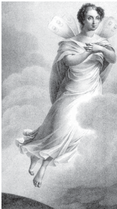
Императрица Елизавета Алексеевна в образе Психеи