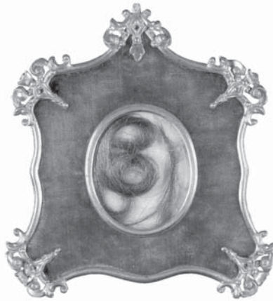
Медальон с волосами Александра I и Елизаветы Алексеевны

Многочисленные изобразительные произведения: гравюры, картины, рисунки и т.д. изображали смерть императора в скромной комнате на походной кровати в окружении свиты и сидевшей рядом супруги. Н. Данилевский назвал это «духом венценосных супругов», представляя трагический миг смерти как момент духовного единения 54 . С того времени культ династии, семьи достиг бессмертия, семейного союза в будущем 55 . После полного