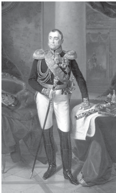
Ф. Крюгер. Князь П. М. Волконский. ГЭ

Она приказала поставить в ту комнату, где скончался ее супруг, походную церковь, чтобы иметь возможность каждый день присутствовать в ней на панихиде. Окружение восприняло ее решение