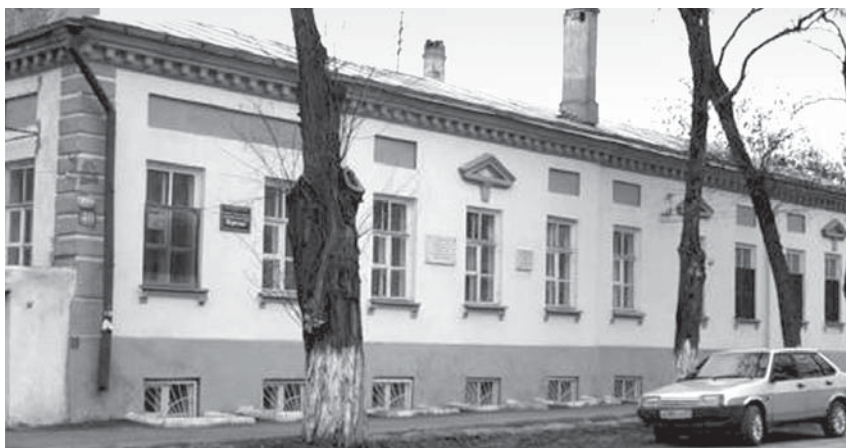
Дом, в котором скончался Александр I. Таганрог

сеевны, сопровождаемая шталмейстером, гусарами и пажамы, не было ни военного штандарта, ни адмиралтейского, ни «Радостного» знамени, наконец, отсутствовал латник в золотой броне. Зато присутствовали некоторые детали, относившиеся непосредственно к императрице, урожденной принцессе Баденской, – среди гербов несли герб Великого герцогства Баденского. Так как главная общественная деятельность российской императрицы была связана с делами богоугодными, в шестии следовали воспитанницы, наставницы и учителя благотворительных заведений, находившихся под особым покровительством почившей государыни. Среди ее орденов были представлены – испанский Марии-Луизы; российские: Св. Иоанна Иерусалимского, Св. Анны, Св. Александра Невского (который в то время жаловался вместе с орденом Св. Андрея Перво-