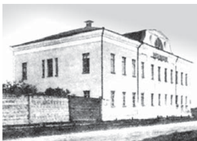
Белевский вдовый дом

Последний перед остановкой в городе Белеве переезд был большим – сто верст от Орла. На подъезде к городу, недалеко от села Мишенского, в котором родился В. А. Жуковский, императрица почувствовала себя дурно. В город были посланы белевские капитан-исправник и городничий Колениус, чтобы разогнать народ, приготовившийся к торжественной встрече. Было решено не беспокоить Елизавету Алексеевну, поэтому по домам было отправлено и духовенство,