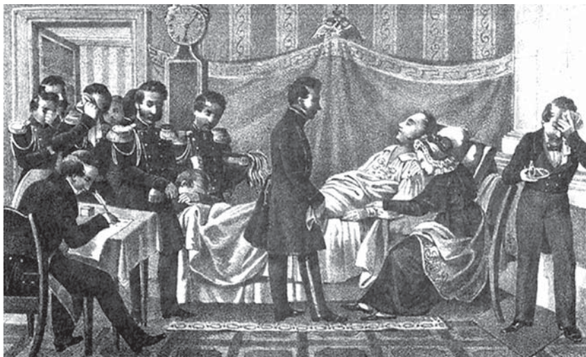
Смерть Александра I

званного), Св. великомученицы Екатерины, Св. апостола Андрея Первозванного. Из корон задействована только малая Императорская корона 51 .