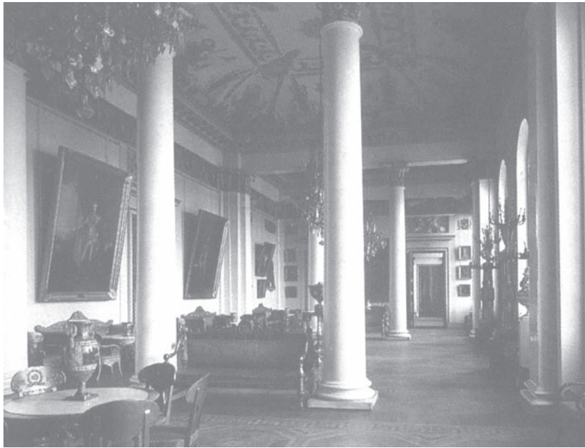
Экспозиция картин иностранных художников, работавших в России (Белый зал). 1923 г.

вращен мебельный гарнитур; в период послевоенной реставрации поздние хрустальные люстры заменили на люстры работы Росси из Овального зала и столовой Елагина дворца. В целом зал сохранил свой ампирный стиль. Он стал местом для проведения наиболее ответственных выставок искусства XVIII – первой половины XIX веков. Там экспонировали лучшие образцы парадной портретной живописи, представляли также шедевры русской скульптуры. В те годы в экспозиционной работе применялся комплексный принцип: наряду с живописью и скульптурой в большом числе выставлялись предметы русского декоративно-прикладного искусства. В смежных с Белоколонным залах картина была, по сути, идентичной. Использование нашего зала для временных экспозиций, когда внимание зрителя обращено к выставленным в нем произведениям искусства, несколько нивелировало его индивидуальный облик.