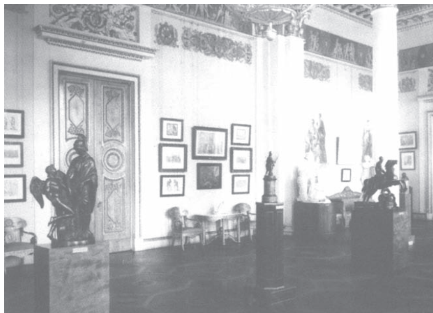
Выставка М. И. Козловского в Белом зале. 1953 г.

В советское время, с ликвидацией Памятного отдела, в экспозицию Белоколонного 6 зала был воз-