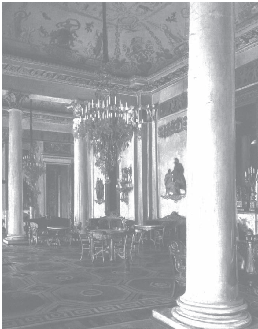
Белая гостиная Михайловского дворца. Э. Липгарт. Нач. 1890-х гг. Живопись

В 1833 году Белая гостиная, единственная из всех интерьеров дворца, была запечатлена М. Садовниковым на акварели, хранящейся ныне в Музее архитектуры им. Щусева (Москва). Изображена юго-восточная часть зала. В интерьере все подчинено замыслу ар-