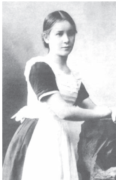
Портрет воспитанницы Елизаветинского института. Фото. 1912 г.

Институтки были весьма благосклонно приняты культурной элитой конца XVIII — начала XIX века. Литераторы превозносили новый тип русской светской женщины, хотя и усматривали в нем совершенно раз-