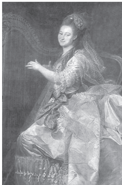
Г. И. Ржевская. Худ. С. П. Левицкий. 1773 г.

Если первые «смолянки» воспитывались в гуманной и творческой атмосфере, которую поддерживал просветительский энтузиазм основателей Воспитательного общества, то впоследствии возобладал формализм и рутинность обычного казенного учреждения. Все воспитание стало сводиться к поддержанию порядка, дисциплины и внешнего благообразия институток. Основным средством воспитания были наказания, что отдаляло институток от воспитательниц, большинство которых составляли старые девы, завидовавшие молодежи и с особым рвением исполнявшие свои полицейские обязанности. Естественно, что между воспитательницами и воспитанницами зачастую шла самая настоящая война. Она продолжалась и в институтах второй половины XIX века: либерализацию и гуманизацию режима сдерживал недостаток хороших и просто квалифицированных воспитательниц. Воспитание по-прежнему основывалось «больше на манерах, меньше держать себя comme il faut , отвечать вежливо, присесть после выслушания нотации от классной дамы или при вызове учителя, держать корпус всегда прямо, говорить только на иностранных языках» 4 .