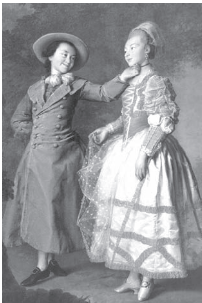
Портрет Е. Н. Хрущевой и Е. Н. Хованской. Худ. Д. Г. Левицкий. 1773 г.