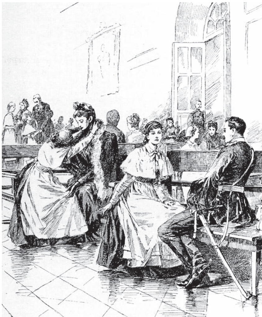
Прием гостей в институте.

Институт строго оберегал младенческую непорочность своих воспитанниц. Она считалась основой высокой нравственности. В стремлении оставить институток в неведении относительно греховных страстей и пороков воспитатели доходили до форменных курьезов: иногда седьмую заповедь даже заклеивали бумажкой, чтобы воспитанницы вообще не знали, о чем здесь идет речь 15 . Варлам Шаламов писал и об особых изданиях классиков для институток, в которых «было больше многоточий, чем текста»: «Выброшенные места были собраны в особый последний том издания, который ученицы могли купить лишь по окончании института. Вот этот-то последний том и представлял собой для институток предмет особого вожделения. Так девицы увлекались художественной литературой, зная «на зубок» последний том классика» 16 . А между тем даже скабрзные анекдоты об