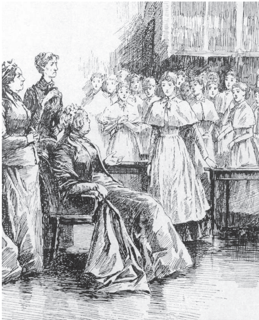
Матан и институтки.

Обстоятельства жизни в закрытом учебном заведении замедляли взросление институток. Хотя воспитание в женском обществе и акцентировало зарождавшиеся в девушках душевные переживания, формы их выражения отличались детской об-