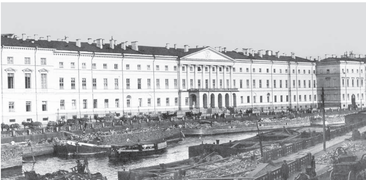
Екатерининский институт (Санкт-Петербургское училище ордена св. Екатерины) на Фонтанке. Фото. 1890-е гг.