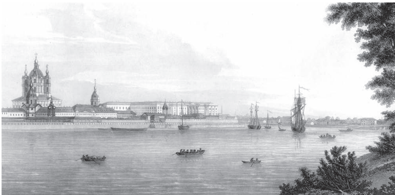
Вид монастыря Благородных девиц в Санкт-Петербурге. Худ. М.-Ф. Даман-Демартре. 1813 г.

Е. Самокиш-Судковская. Ил. к книге Н. А. Лухмановой «Девочки. Воспоминания из институтской жизни» (СПб., 1896)