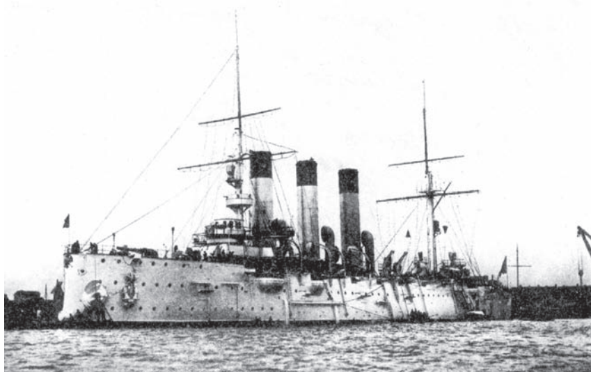
Бронепалубный крейсер I ранга «Аврора» в период достройки

Первая мировая война 1914—1918 годов. Русский военно-морской флот активно готовился к той