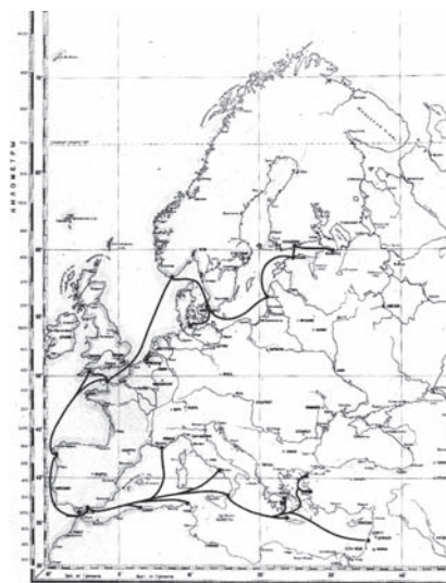
Карта-маршрут похода крейсера «Аврора»: ноябрь 1909—март 1911 гг.

А в сентябре 1911 года крейсер вновь ушел в плавание: Балтийское, Северное моря, Атлантический океан, Средиземное, Красное, Аравийское, Южно-Китайское моря. Порты Плимут, Неаполь, Суэц, Аден, Коломбо, Сингапур, Джибути, Порт-Саид, Алжир, Кристиансанн, Шербур, оставив за кормой 26 275 миль.