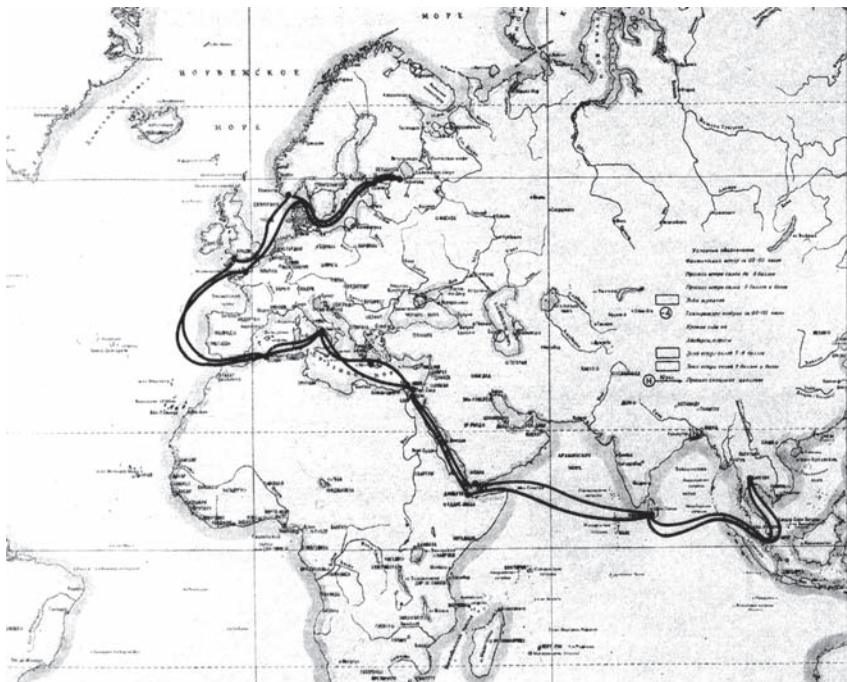
Карта-маршрут дальнего похода крейсера «Аврора»: ноябрь 1911 — июль 1912 г.

войне: особо важное значение отводилось Балтийскому флоту. На него возлагалось обеспечение правого стратегического крыла фронта вооруженной борьбы и оборона столицы от возможных ударов сильного германского флота.