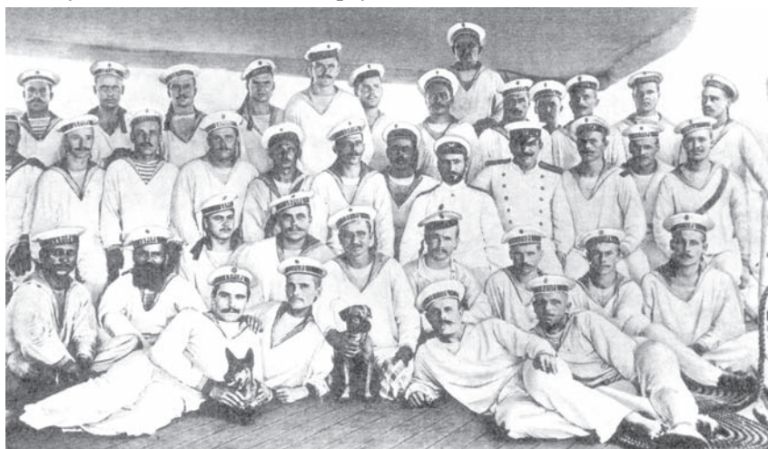
Авроровцы — участники Цусимского сражения

Личный состав большинства кораблей русской эскадры проявил высокое мужество и стойкость в бою с превосходившими его силами японского флота. Особенно самоотверженно сражались матросы. Так, например, описывал их поведение в дневном бою один из его участников — офицер крейсера «Аврора»: «Наши команды держались в бою выше всякой похвалы. Замечательное хладнокровие, находчивость и неустрашимость проявлял каждый матрос. Золотые люди и сердца! Они заботились не столько о себе, сколько о своих командирах, предупреждая о каждом непри-