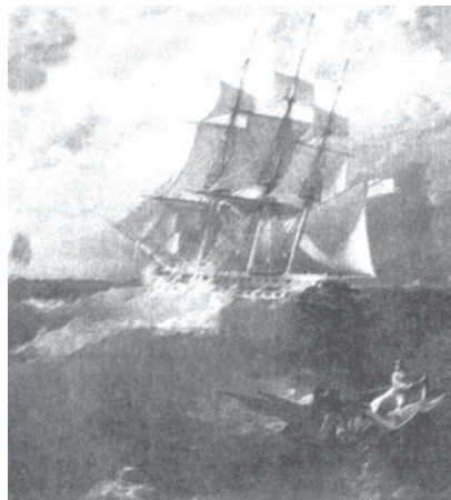
Трехмачтовый парусный фрегат «Аврора». Худ. П. Т. Борисколец

Старый Свет — Неужто мирного решения нет? Идет корабль к восточным берегам, А кровь вот льется тут да там.