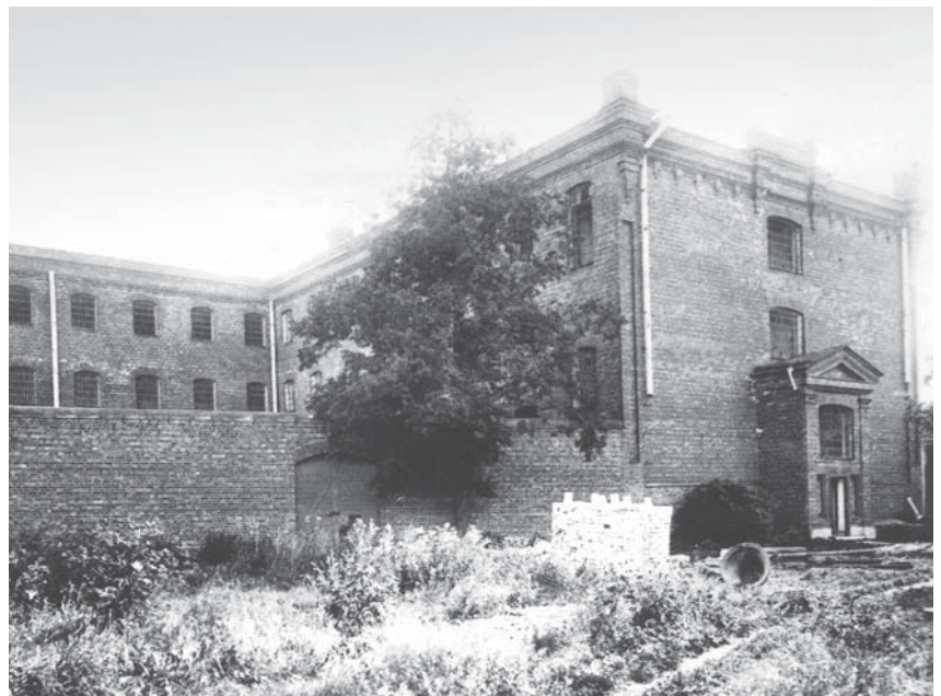
Четвертый тюремный корпус. 1917 г.