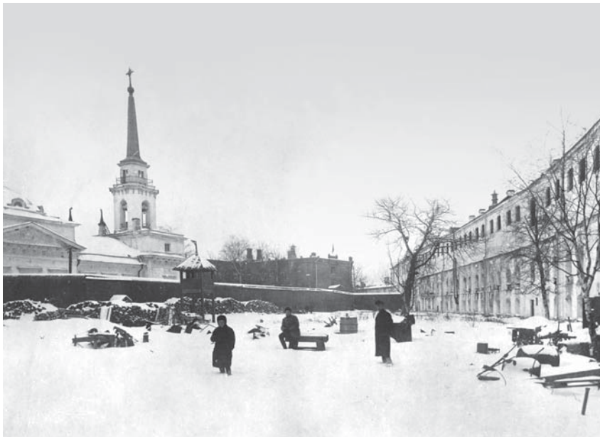
Крепостной двор: Иоанновский собор, четвертый тюремный корпус, первый тюремный корпус «Зверинец». 1917 г.

с современной организацией тюремной системы, он совершил обширную учебную поездку по странам Западной Европы. Его планы имели чисто гуманитарные цели, он хотел помочь попавшим в беду людям.