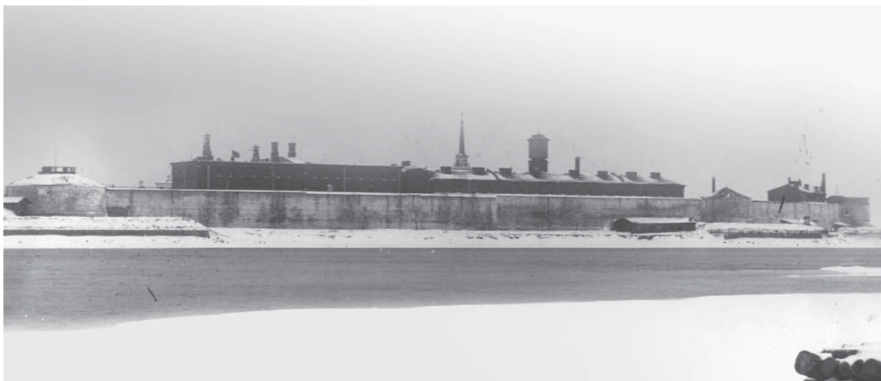
Вид Шлиссельбургской крепости с левого берега Невы