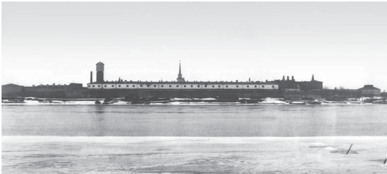
Вид Шлиссельбургской крепости с правого берега Невы. 1908–1917 гг.