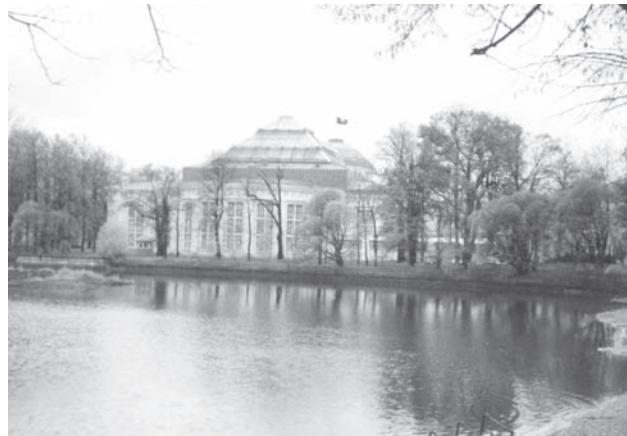
Вид на Таврический дворец из сада.