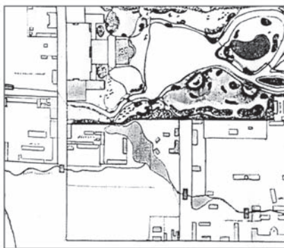
План первой очереди Таврического сада. Чертеж. 1786 г.

В письме к барону Гримму Екатерина II сообщала: «...выращиваем столько ананасов, что не только к столу, но и на продажу хватает».