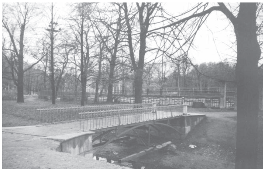
Старинные мосты конца XVIII в.