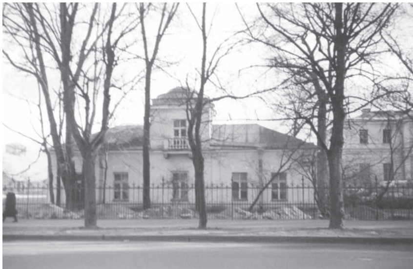
Левый флигель Дома садового мастера. Фото автора