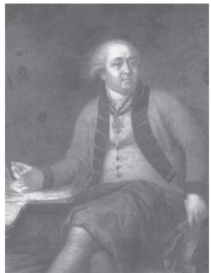
Архитектор Иван Евгеньевич Старов (1745–1808)

Вернемся к первой версии. Из множества проектов Потемкин выб-