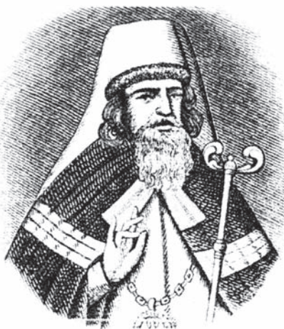
Портрет Стефана Яворского. С гравюры И. Зубова. 1719 г.

Этой своей статьей о Таврическом саде я хочу отдать дань памяти моему далекому и невозвратному детству.