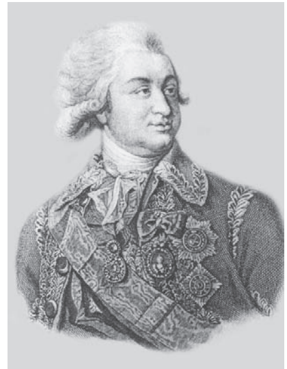
Г. А. Потемкин. Гравюра с портрета работы Дж. Уокера. 1780-е гг.

Прежде чем говорить о дворце на Воскресенской улице, обратимся