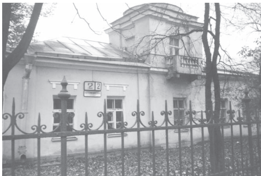
Правый флигель Дома садового мастера. Фото автора

ся любимым местом пребывания императрицы весной и осенью. Здесь обосновался и Двор, «который, по обыкновению, с первых весенних дней, переехал в Таврический дворец» 25 . Во дворце находились и апартаменты последнего фаворита Екатерины — Платона Зубова. В том же году Конногвардейский дом был официально переименован в Таврический дворец. К последним годам правления Екатерины II относятся воспоминания князя Адама Чарторижского, польского дворянина, будущего российского министра и друга юности императора Александра I. «Иногда вблизи Таврического дворца устраивались две ледяные горы. Великая княгиня, княжны и все придворные отправлялись туда кататься с гор на