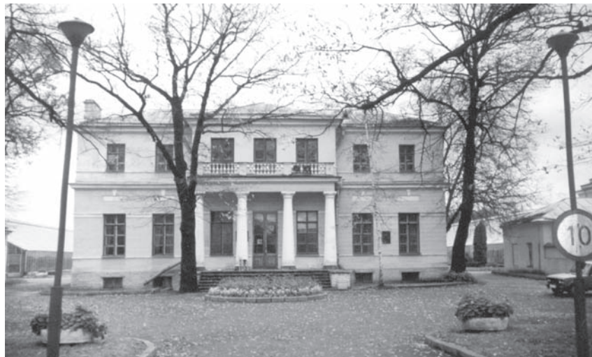
Дом садового мастера. Арх. Ф. Волков. 1793–1794 гг.

Здесь мы вновь обратимся к Г. Р. Державину и дополним описание сада из его воспоминаний: «...во внешнем, весьма просторном и прекрасном саду возжены были увеселительные огни. Хотя пасмурная погода не позволяла всем утешаться ими, но любопытство приметило оные. Там, на прекрасных прудах, чешующихся меж-