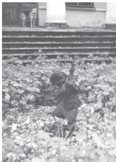
Фонтан перед Домом садового мастера.

ду открытоюпологою зеленью, а инде древами осененных, зыблилась флотилия, из нескольких судов состоявшая, украшенная разноцветными флагами и фонарями, со множеством матросов и гребцов, богато одетых. Роши, приятно разбросанные, и алеи, далеко простирающиеся, также испещрены были разными огнями. Всего приятнее казалось помавание дерев над водами стоящих, которые от случившагося тогда нарочитаго ветра наклоняясь и возвышаясь, заставляли по колеблющемуся под ними стеклу пробегать то зеленя, то красныя струи. Все дороги были покрыты народом, толпящимся подобно рою пчел, привившихся к тому месту, где матка их находится. Шорох дерев, шум вод катящегося водопада, жужуканье говорящих, глас в далеке гребцакого рога и песен, слы-