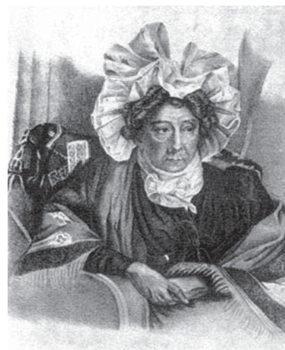
Графиня Наталья Кирилловна Загряжская (1747–1837), воспитавшая жену министра – графиню Марию Васильевну Кочубей

Этот дом всегда вызывал живой интерес петербургской знати не только потому, что в нем жил граф В. П. Кочубей – приближенный императорской фамилии, «вельможа во всем пространстве сего слова» 2 . Немалая заслуга в придании этому дому всеобщей популярности принадлежала теще министра Наталье Кирилловне Загряжской, старшей дочери последнего гетмана Малороссии графа К. Г. Разумовского, прожившей в этом доме до самой кончины в 1837 году. А ее муж Николай Александрович Загряжский стал жить отдельно, переехав на другую квартиру. Но все это не мешало супругам поддерживать дружеские отношения и видаться почти ежедневно.