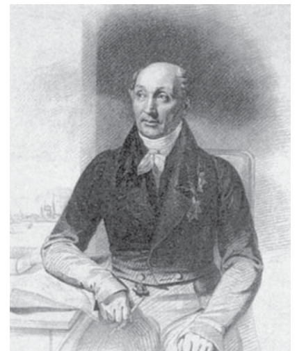
Граф Михаил Михайлович Сперанский (1772–1839)