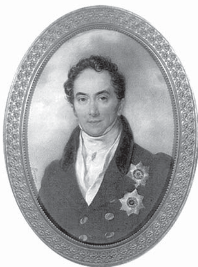
Министр внутренних дел граф (князь с 1831 г.) Виктор Павлович Кочубей

Как и все аристократические фамилии Северной столицы, семья графа В. П. Кочубея зимой жила в городе, а летом на даче.