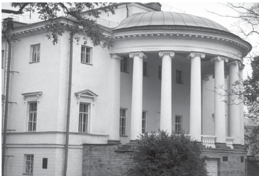
Запасной дворец. Царское Село.