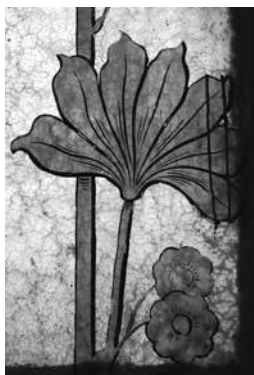
19-я линия, 14 / Большой пр. В. О., 54 Расписные стекла в перегородке, фрагмент. 1911