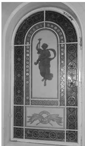
2-я линия В. О., 23. Комбинированный витраж с аллегорическим изображением. 1880-е. Мастерская Э. Шмидта (Берлин)