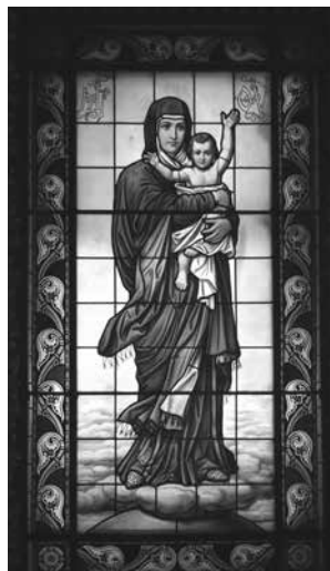
Камская ул., 24. Комбинированный витраж — алтарный образ в церкви Смоленской иконы Божией Матери на Смоленском православном кладбище. 1900-е. Мастерская «М. Франк и К°». Перемещен из часовни в институте Д. И. Отта