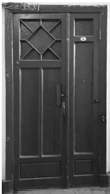
9-я линия В. О., 54. Дверь с фактур- ным стеклом «муранезе». 1900-е