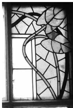
9-я линия В. О., 26. Единственный сохранившийся фрагмент витражного полотна во фрамуге окна на площадке 2–3-го этажей