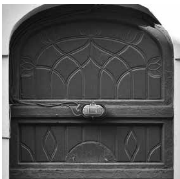
Средний пр. В. О., 27. Наддверный витраж в свинцово-паечной технике