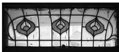
14-я линия В. О., 41 / Средний пр., 56 Витраж наддверного проема. 1909