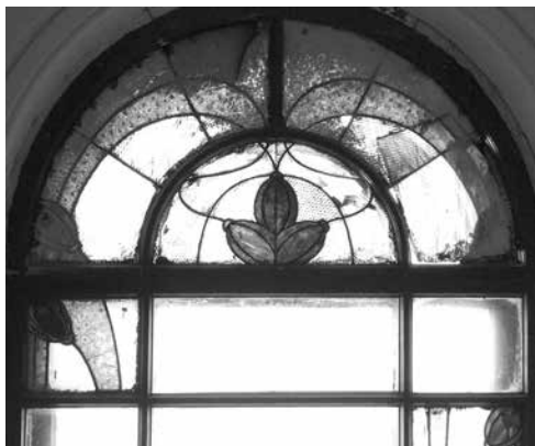
18-я линия В. О., 9. Витраж в свинцово-паечной технике в окне верхнего этажа лестничного объема. 1900-е, аварийное состояние

фацетное, фактурное стекло в оконных и дверных рамах, любые имитационные техники витражного искусства, гравировка и травление на бесцветных стеклах, роспись художественная и по трафарету.