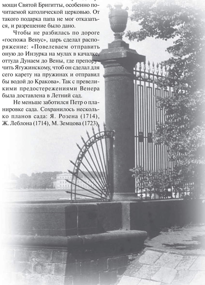
Ограда Летнего сада

Часть теперешнего Летнего сада и Марсова поля представляла собой тогда низину, поросшую чахлым кустом.