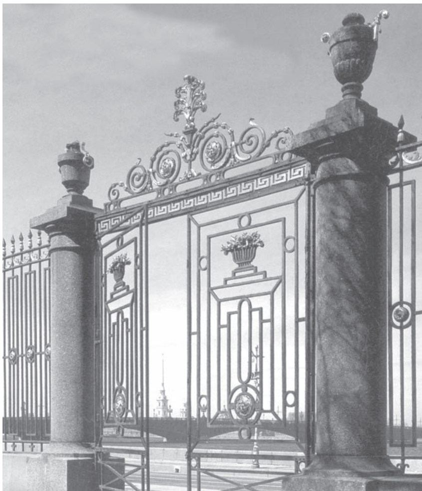
Ограда Летнего сада. Фрагмент. Арх. Ю. Фельтен и П. Егоров

На стенах различных комнат Летнего дворца висят портреты членов се-