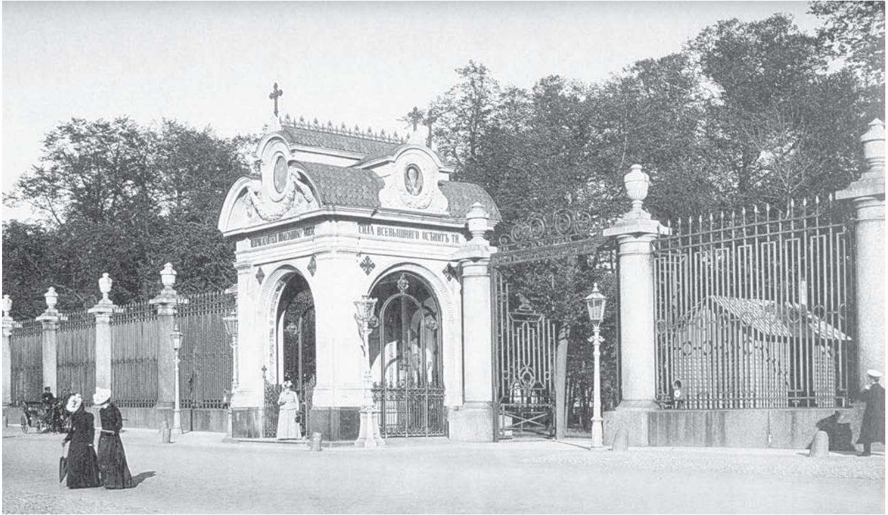
Ворота Летнего сада. Слева — часовня. 1890-е гг. Инв. ЭРФт-85

то же время сохранившие уютный и какой-то обжитой, радостный вид, не могли не привлечь Петра.