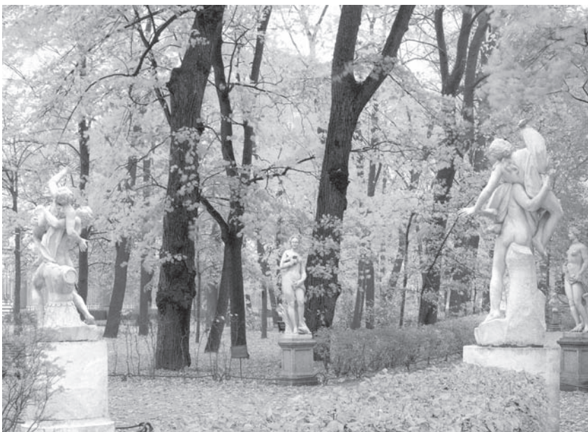
Алея Летнего сада

В литературе о Летнем саду акцент делался на сюжетах, прославлявших победу России над Швецией. Однако богатейший «материал» самого искусства, расцветшего в Летнем саду и в Летнем дворце Петра, позволяет расширить эту позицию. В числе первых мраморных бюстов, украсивших сад, был портрет шведской королевы Христины. Современный шведский историк Бенгт Янгфельд в статье «Граф Готландский посещает Санкт-Петербург» пишет: «Король был польщен приемом, оказанным ему в Академии наук, где он, в частности, мог полюбоваться несколькими бюстами выдающихся шведов: королевы Кристины, Линнея и химика Валериуса» 4 . Таким образом, появление бюста шведской королевы Христины в Летнем саду получает совсем иное звучание. А скульптурную группу Летнего сада «Амур и Психея» можно было тогда трактовать так: две державы — Россия и Швеция — увидели друг друга в свете мира и полюбили друг друга.