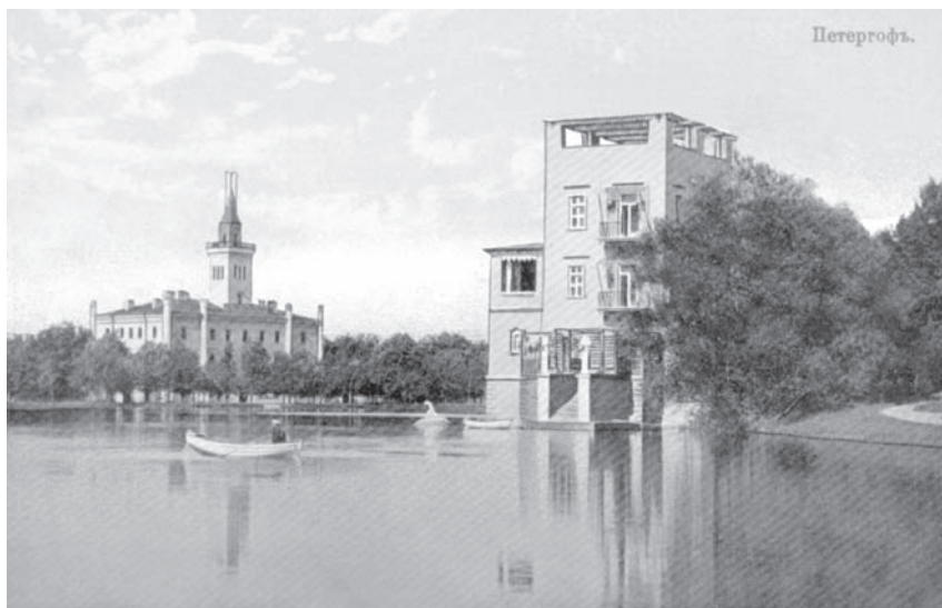
Ольгин павильон и Дом полиции. Открытка.

нялись по столице. Увеличивалось количество пароходных рейсов в Петергоф. Ожидалось большое стечение публики, что вызывало беспокойство организаторов праздника 39 . Предполагалось вызвать в помощь петергофской полиции коллег из Петербурга, но император «не изъявил высочайшего соизволения» на это, сочтя, что имеющихся в Петергофе жандармов достаточно 40 . Им в помощь был назначен один эскадрон лейб-гвардии Конно-пионерского дивизиона 41 .