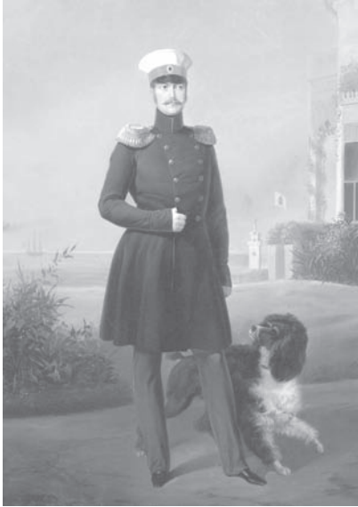
Император Николай I. Е. Ботман. 1949 г. ГМЗ «Петергоф»