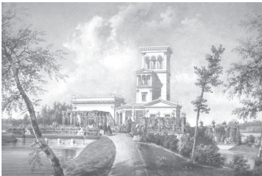
А. Премацци. Павильон Озерки в Луговом парке. 1850. ГМЗ «Петергоф»

В Петергоф на праздник выезжали управляющий конторой Императорских театров А. Д. Киреев, помощник управляющего театральным училищем Аубель, балетмейстер Ж. Перро, режиссер Марсель, дирижер оркестра Франк, экзекутор конторы Гайдуков, а также помощник режиссера, 21 танцовщица, 20 воспитанниц училища, при них 2 гувернантки, 70 музыкантов, 5 капельдинеров, нотный копиист, 2 бутафора, 6 горничных, 2 костюмера, 2 парикмахера, 13 портных мужских и женских и 2 цветочницы 56 . Участникам представления были пожалованы подарки. Балетмейстеру Ж. Перро и декоратору А. Роллеру были вручены перстни с темными топазами, дирижеру Франку и режис-