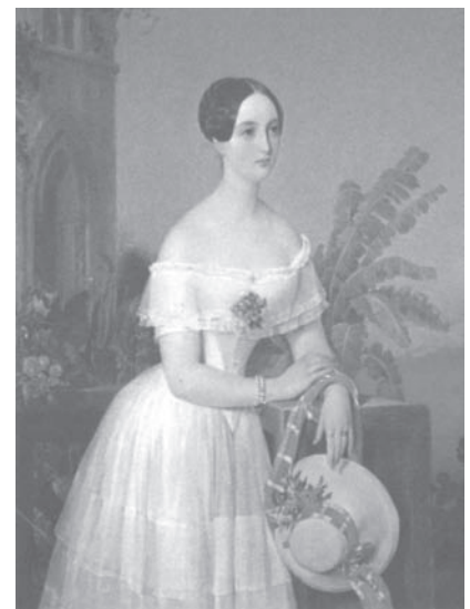
Великая княжна Ольга Николаевна. П. Орлов. 1846 г. ГМЗ «Петергоф»

Уже через месяц в Петергофе, в день рождения Николая Павловича,