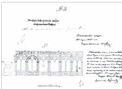
Подпись карандашом: «На Озерках, по обе стороны фигуры Нила»

Р. И. Кузьмин. Рисунки для иллюминации 1846 г. в Нижнем парке Петергофа (с карандашными пометками Николая I 1851 г.). ГМЗ «Петергоф». Публикуются впервые