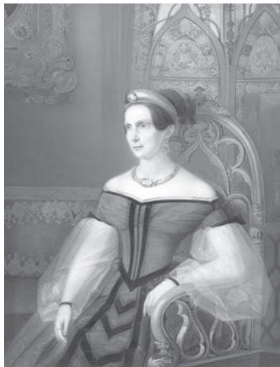
Императрица Александра Федоровна. В. Гау. 1834 г. ГМЗ «Петергоф»

Возвращавшихся из Италии жену с дочерью Николай выехал встречать в Варшаву. В честь его приезда 11 (23) мая в Лазенках был устроен праздник с иллюминацией. Газета «Варшавский курьер», сообщая об этом празднике, отметила, что парк был иллюминирован «цветными лампами, помещенными на колоннах» 2 . 25 мая 1846 года