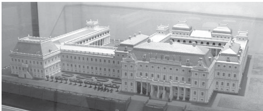
Дворец Меншикова на 1725 г. Южный фасад (макет)

Согласно «Повседневным запискам» А. Д. Меншикова (сохранившимся за 1716–1720 и 1726–1727 годы), в 1716 году светлейший князь с семьей жил в деревянном дворце только в летние месяцы (в то время как в каменном велись строительные работы). Например, от 4 августа: «...его светлость... прибыл на Васильевский остров, где також в доме своем, гуляя по строениям, отшел в деревянные покои» 18 . 1 сентября А. Д. Меншиков приехал «в дом свой на Васильевской остров. И по прибытии в полаты (то есть каменный дворец. – Е. А.) изволил приказать дражайших своих детей принести, которые пребывали в деревянных хоромах...» 19 И с того времени светлейший князь, несмотря на то, что работы в каменном дворце продолжались, жил только в нем. К примеру, 18 сентября Меншиков «...изволил ехать на Васильевской остров в дом свой, и по прибытии,