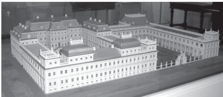
Дворец Меншикова на 1725 г. Северный фасад (макет)