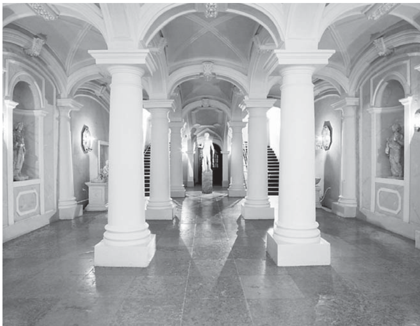
Дворец Меншикова. Сени первого этажа. Современный вид

коллегия. Сад А. Д. Меншикова «со всяким строением и аранжерееми в нем, и при нем и с уборами» по именному указу от 4 сентября 1731 года поступил в ведомство интенданта Кормедона. Деревянный двор А. Д. Меншикова – подполковнику Фуксу под фейерверки 45 .