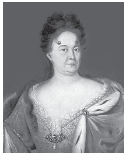
Неизвестный художник. Светлейшая княгиня Д. М. Меншикова. Первая четверть XVIII в.

дебную залу», где «трапезничали» и танцевали «до 11 часов ночи». После этого новобрачные удалились спать в специально отведенное помещение в доме светлейшего князя. На следующий день пир продолжался с двух часов дня. Датский посланник отмечает, что первый день свадьбы был устроен на деньги Петра I, а второй – на средства Меншикова 5 . Таким образом, если в первый день