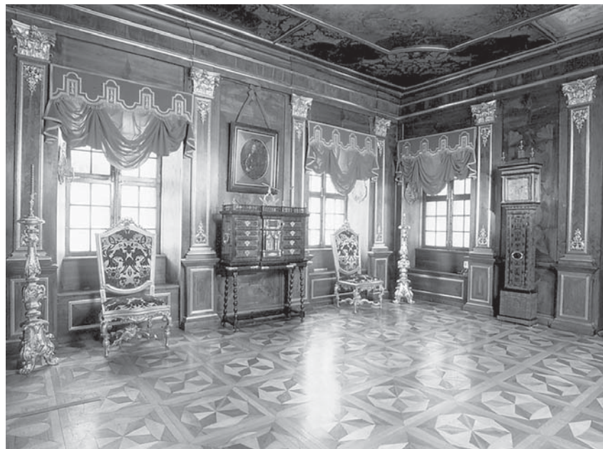
Дворец Меншикова. «Ореховая». Современный вид

Знаменитая «Ореховая» при Меншикове согревалась мраморным камином (позднее, при кадетах, замененным голландской печью с расписными бело-синими изразцами, сохранившейся и по сей день) 53 . Но основная отделка стен