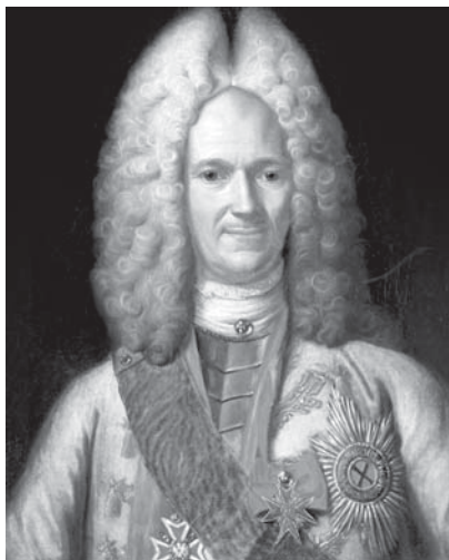
Неизвестный художник. Светлейший князь А. Д. Меншиков. Первая четверть XVIII в.