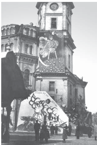
Интернационал несет смерть войне. Плакаты на здании Городской думы. Петроград, 1919 г.