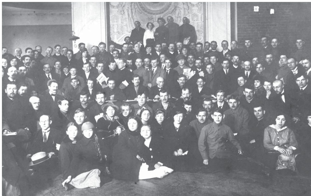
Вторая Петроградская конференция культурно-просветительных организаций. Июнь 1918 г.