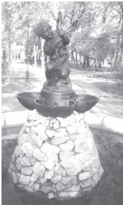
Фонтан «Мальчик с гусем».

Свою статью о Таврическом саду, написанную полгода назад, я закончил на полупессимистической ноте. Была надежда на лучшее, но когда наступит это лучшее? И вот накануне 300-летия Петербурга прочел в «Санкт-Петербургских ведомостях», что в Таврическом саду были проведены большие работы по реконст-