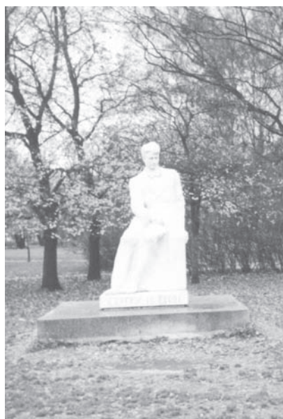
Памятник Сергею Есенину.

выполнен авторским коллективом в составе архитекторов Ф. К. Романовского и С. Л. Михайлова, скульптора — А. С. Чаркина. Строительство и установку выполнил комбинат «Скульптура».