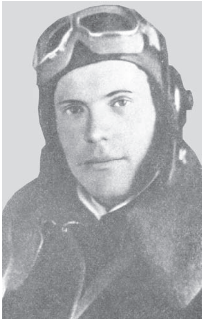
А. Т. Севаст'янов. Апрель 1942 г.

кие летчики спустились на парашютах и были задержаны патрулем на улице Маяковского. От сильного удара отважного летчика выбросило из кабины. На время он потерял сознание, но, когда очнулся, дернул за парашютное кольцо и приземлился на территории Невского машиностроительного завода. Очень скоро весь город узнал, что этот ночной воздушный таран совершил младший лейтенант 26-го истребительного полка двадцатитрехлетний Алексей Севаст'янов. Через полгода, при выполнении нового задания, мужественный летчик погиб. За эти подвиги ему было присвоено звание Героя Советского Союза, а его именем названа улица в Московском районе города. За 4 года войны в сад были сброшены 43 фугасные бомбы, множество зажигательных бомб и артиллерийских снарядов. Бомбежки и обстрелы нанесли значительный урон садовым долгожителям — дубам, вязам и липам. Один из снарядов был обнаружен в 1971 году при строительстве здания для новой игротеки.