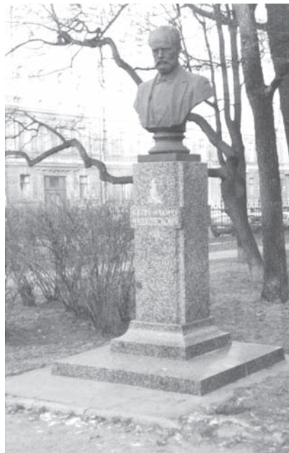
Бюст П. И. Чайковского.

В октябре 1995 года в связи с празднованием 100-летия со дня рождения Сергея Есенина в Таврическом саду был установлен мраморный памятник поэту. Финансировал все работы благотворительный фонд имени Сергея Есенина. Памятник