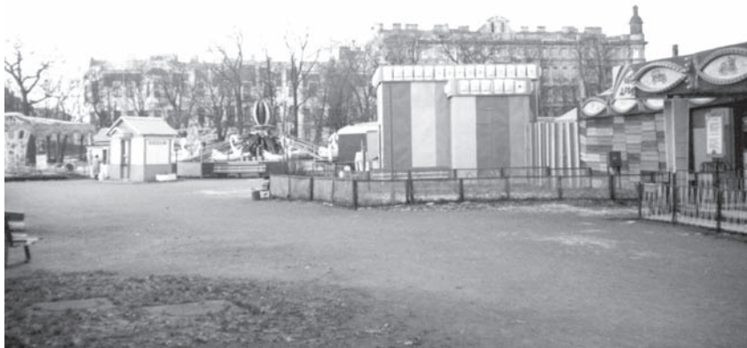
Парк аттракционов на территории Таврического сада.

Первая очередь нового выставочного комплекса у Таврического сада состояла из двух объектов. На месте снесенной бывшей одноэтажной казармы протянулась декоративная 20-метровая стена, облицованная серым сааремским доломитом. Улица Воинова расширилась здесь на 20 метров. Перед стеной-витриной был разбит зеленый газон. По красной линии улицы Воинова высадили аллею стриженных лип. Аллея образовала бульвар, выложенный квадратными плитами из светлого бетона.