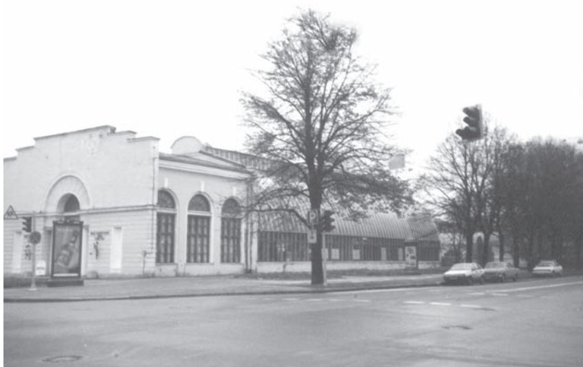
Реконструированное здание пальмовой оранжереи.

«У Таврического парка сейчас несколько хозяев. Деревьями, кустами, травой, озерами — гибнущим на глазах ландшафтом — ведает Трест эксплуатации зеленых насаждений. Атракционами — Ленаттракцион. Кооперативом «Горка»,