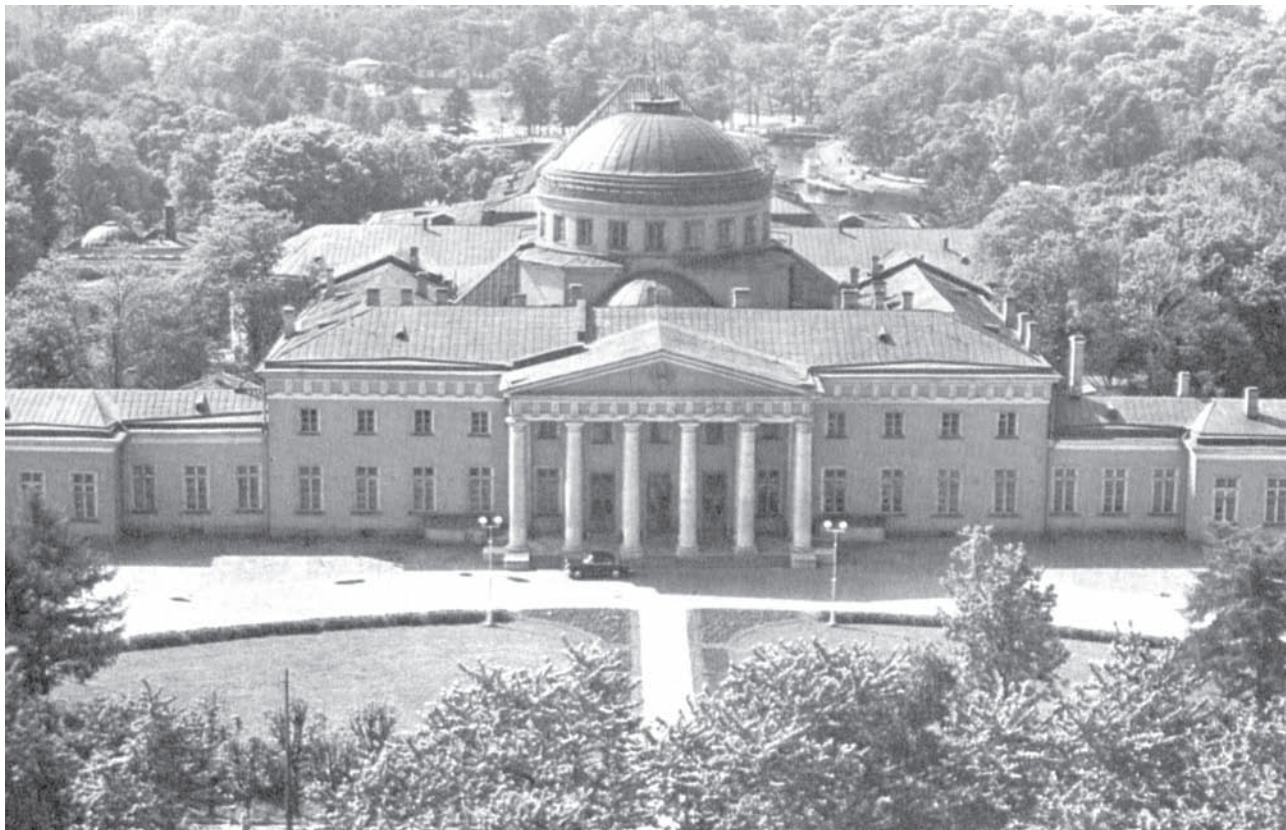
Таврический дворец и сад.

От площадки с памятником пионерам-героям был построен гранитный спуск к воде. В день юбилея пионерской организации у памятника был зажжен вечный огонь Пионерской славы от огня на Марсовом поле. Была высажена «Аллея 50-летия пионерии» из 50 дубков, где были установлены стенды, рассказывавшие о подвигах юных героев. На юбилейной стройке работало более 7 тысяч ребят.