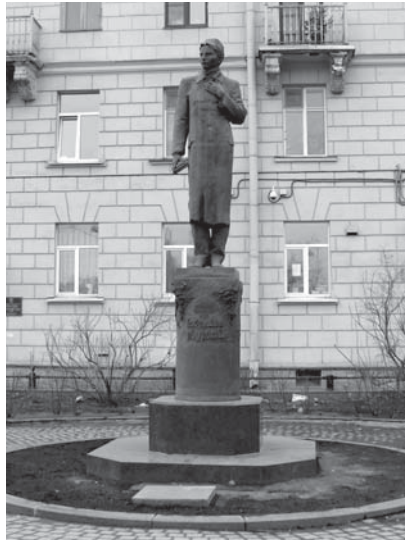
Памятник Г. М. Тукаю