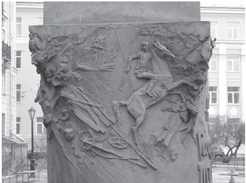
Памятник Г. М. Тукаю. Постамент. Рельеф «Шурале». Скульптор А. Г. Зиякаев