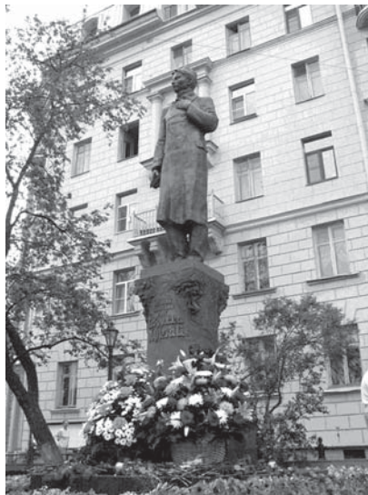
Открытие памятника Г. М. Тукаю 25 июня 2006 г.

Далее «Шурале»: мы видим Шурале, джигита на коне, деревню из этой сказки.