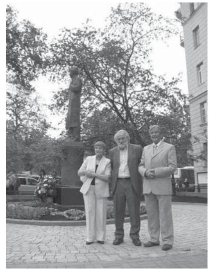
Открытие памятника Г. М. Тукаю 25 июня 2006 г. Слева направо: архитектор Г. Л. Шолохова, скульптор Я. Я. Нейман, архитектор С. П. Одновалов

Эта поэма о находчивости». Отлитый из бронзы 16 цилиндрический постамент установлен на восьмигранную гранитную 17 призму, которая в свою очередь поставлена на восьмиугольный цоколь большей площади. Бронзовая фигура Г. Тукая двумя пиронами крепится к граниту. В центре постамента надпись кириллическим декоративным шрифтом, стилизованным под арабское письмо и украшенным надстрочными точками: «Великий татарский поэт Габдулла Тукай».