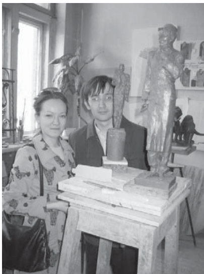
Скульптор А. Г. Зиякаев. Эскизы к проекту памятника Г. М. Тукаю. Пластлин. 2006 г.

и консультировался у знаменитого профессора, который констатировал тяжелейшее заболевание – три четверти легких были уже разрушены туберкулезом. Это был последний год его жизни.