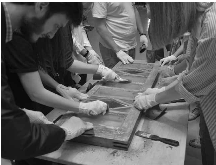
Мастер-класс по очистке витражей

Отдельное внимание необходимо обратить на деятельность движения в Санкт-Петербурге, в рамках которого менее чем за два года удалось реализовать более десятка мероприятий общегородского и международного масштаба.