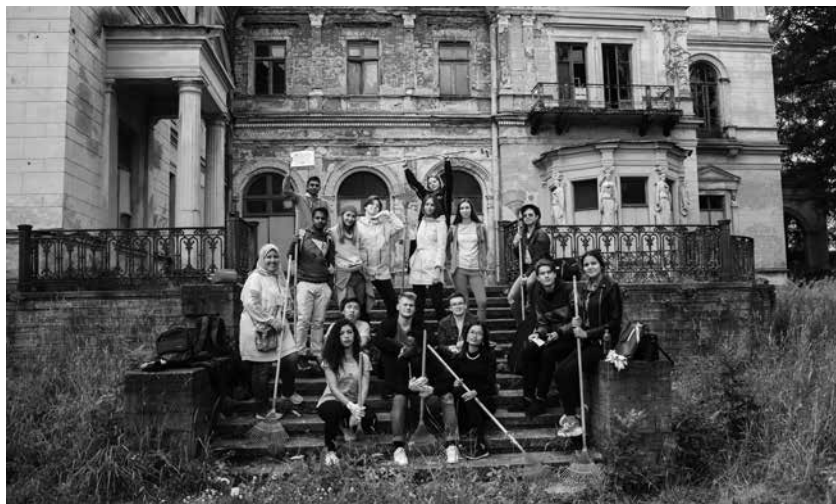
Команда «Культпатруля» на уборке усадьбы Михайловка

Участниками программы стали студенты, активная молодежь из разных стран. Многие учатся в российских вузах, но для кого-то поездка в Россию стала первой. Для каждого иностранного волонтера это событие — путешествие, которое дает возможность поменять окружающее пространство, сделать его лучше, комфортнее.