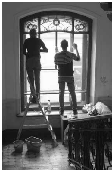
Мытье витражного окна в парадной Петербурга

Особое внимание необходимо уделить проектам, реализованным летом 2019-го, среди которых масштабный фестиваль «неФОН» (Фестиваль О Наследии), проходивший 17–18 июня. В рамках фестиваля на площадке «Севкабель Порт» разместились лекторий, 3 выставки, инсталляция, предоставленная «Том Сойер Фест», зона мастер-классов, посвященных реставрации и живописи, а также зона специальных игровых и обучающих занятий для детей. За два дня мероприятие посетило больше 1000 человек. 7