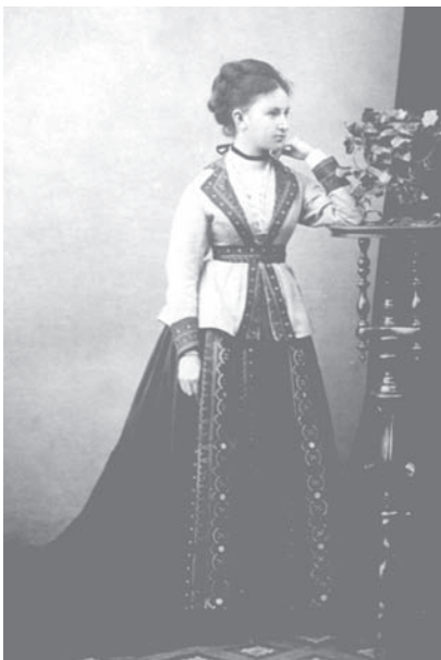
А. Н. Есипова (Музей Санкт-Петербургской консерватории)

и говорит: «Ты знаешь, там пришел Софроницкий, и он тебя слушает!» А я всегда почему-то очень смущалась, когда играла у него, хотя он был очень приятный человек и много помогал мне. Как-то я пришла к нему заниматься, и он мне рассказал такую историю. Он ездил за границу в 1922 году. Был там на гастролях. Его концерты прошли очень успешно. Были очень хорошие отзывы. На одном из концертов он сыграл сонату «По прочтении Данте» Листа. И все очень хвалили. Все говорили, какой он молодец. И кто-то ему сказал: «Вы, наверно, очень глубоко изучили произведения Данте». Тут Софроницкий наклонился ко мне и сказал шепотом: «А я и не читал вообще!» Вот такой был человек. Но с ним было не очень легко. Он совсем иначе слышал музыку. Однажды мы с ним занимались, и я играла ему сонату Шопена, и он мне что-то объяснял и показывал. А буквально на следующий день я включила случайно радио и услышала эту же сонату в его исполнении. Это было совер-