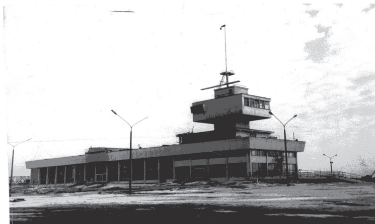
Морской и речной вокзал в Архангельске. 1973 г.