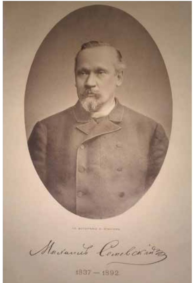
Класен В. Михаил Иванович Семевский. Фотография из ж-ла «Русская Старина». 1892. № 6. Л. 1. ГМЗ «Павловск»