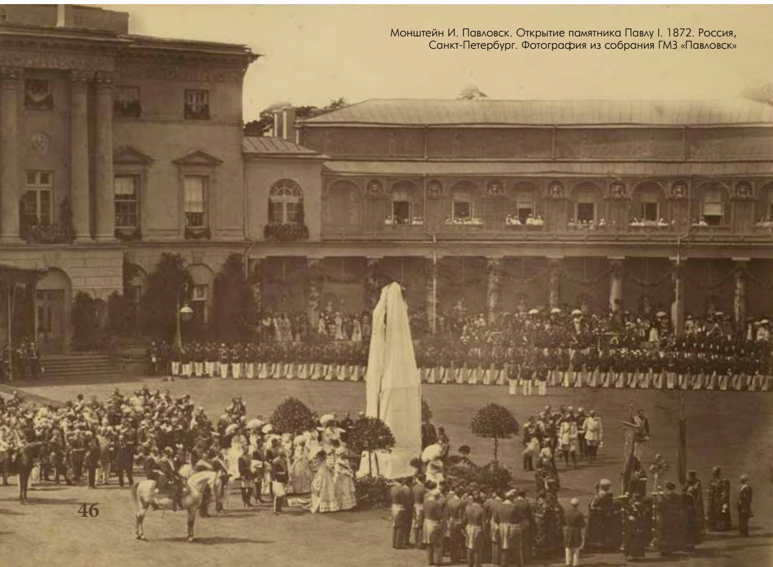
Монштейн И. Павловск. Открытие памятника Павлу I. 1872. Россия, Санкт-Петербург. Фотография из собрания ГМЗ «Павловск»

В 1876 году рассматривался вопрос об установке памятника первой хозяйке Павловска 21 . В смете, составленной А.Н. Чикалевым 22 , указывалось: « Требуется построить грандиозный памятник с бронзовыми украшениями и такую же статую шириною до