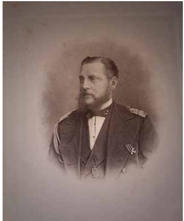
Великий князь Константин Николаевич. 1877. Фотография из книги «Павловск. Очерк истории и описание 1777-1877. СПб.: Тип. II отд.».

В отдельных павильонах намечалось повесить копии гравированных портретов первых владельцев дворца – великого князя Павла Петровича и великой княгини Марии Федоровны. Комнатка Пиль-башни при Марии Федоровне имела вид хорошо убранного кабинета, где хозяйка любила читать и писать, и там автор записки планировал поставить диван, стол и положить на лето один из малых альбомов императрицы, повесить ее портрет или портрет Палатины венгерской Александры Павловны. Ферму предлагалось украсить видами Павловска и положить там