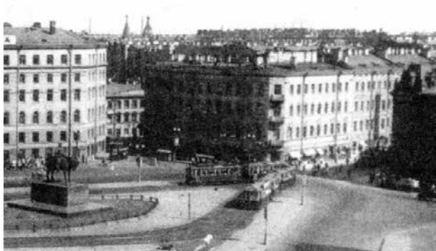
Вид дома № 10 на 1-й Советской ул., 1936 год