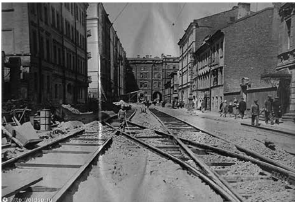
Трамвайные пути на 1-й Советской улице. 4 июля 1930 года