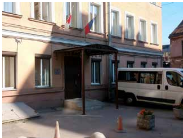
Здание РКК (Гончарная 19Д)

Прежде всего, каждый проживающий в РФ может стать членом одного из региональных отделений РКК по достижении 18 лет. В данном вопросе РКК в очередной раз демонстрирует свою приверженность принципам беспристрастности, независимости и универсальности, потому как принимает в свои ряды граждан РФ, иностранных граждан и лиц без гражданства, не накладывая каких-либо ограничений. Кроме того, любой посетитель официального сайта Санкт-Петербургского отделения РКК может внести добровольное пожертвование на любую сумму как от физических, так и от юридических лиц. Государственная поддержка деятельности РКК в Санкт-Петербурге