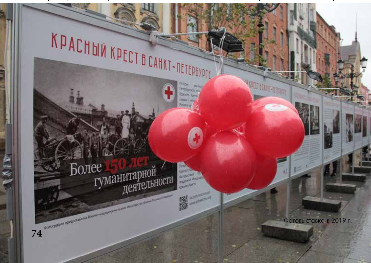
Фотовыставка в 2019 г.

прос предоставления убежища, решение по которому принимают МВД РФ и территориальные органы МВД РФ. 4 Следует уточнить, что с юридической точки зрения не все лица, которые оказались на территории РФ по вынужденным причинам, таким как войны в их родной стране или различного рода преследования (по расовому, религиозному признакам и др.), являются беженцами. Граждане других стран могут претендовать как на получение статуса беженца, так и на временное убежище в РФ. Права, получаемые лицами обеих категорий, во многом схожи. Принци-