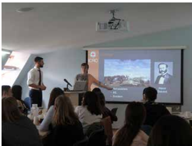
Летняя школа по миграции 2019

также весьма значительна. Уже не первый год Санкт-Петербургское отделение выигрывает президентские гранты на продвижение своих проектов. В 2018 году в рамках данного гранта был реализован проект «Санкт-Петербургский информационный центр по вопросам интеграции и адаптации мигрантов», а в 2019-2020 гг. в жизнь воплощается проект «Интеграция мигрантов и членов их семей в правовое и культурное поле Санкт-Петербурга». Именно на эти деньги РКК в Санкт-Петербурге реализует языковые курсы, координирует политику по адаптации и интеграции мигрантов и беженцев, оказывает юридическую и социальную поддержку, а также проводит мероприятия, связанные с просветительской работой с населением Санкт-Петербурга в отношении беженцев и мигрантов. Немаловажной для национальных обществ Красного Креста, в том числе и для РКК, является и финансовая поддержка, оказываемая Международным Комитетом Красного Креста. 17 В 2018 году многие СМИ писали о скандале, связанном с тем, что МККК якобы прекратил работу с главным офисом РКК и отказался от его финансирования. Тем не менее, по сведениям информационного ресурса РИА Новости представители РКК опровергли данную информацию. 18 У Санкт-Петербургского отделения РКК имеется немало источников финансирования, и безусловно важной здесь является государственная поддержка Фонда Президентских грантов. Тем не менее,