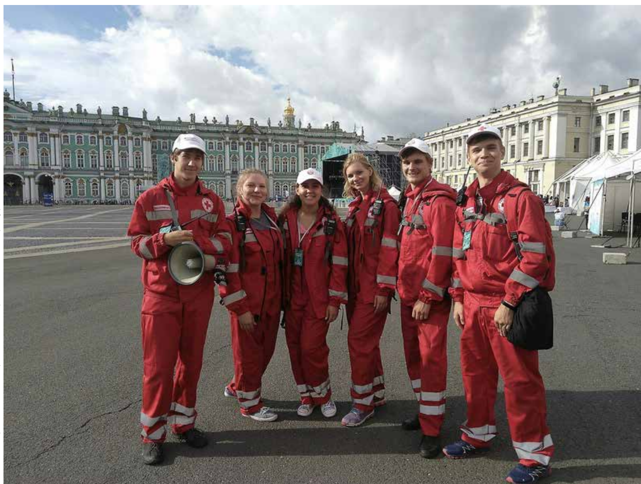
Добровольцы Красного Креста в Петербурге

В данной статье в центре нашего внимания – дея-