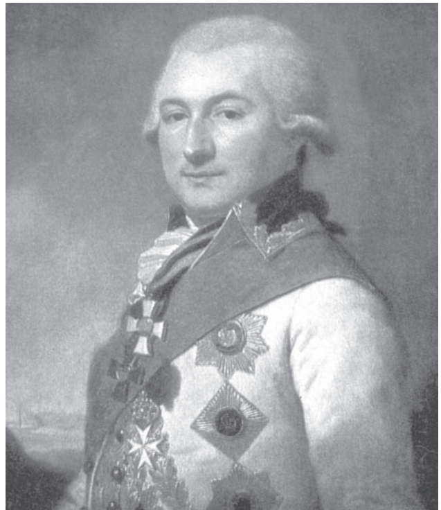
Портрет Хосе де Рибаса. Худ. И. Б. Лампи Старший. Холст, масло

На русскую службу И. М. де Рибас поступил, познакомившись с самим графом А. Г. Орловым-Чесменским в Ливорно в 1773 году 2 . Там помог он знаменитому «Алехану» вывезти из Италии и доставить в Петербург небезызвестную авантюристку «княжну Тараканову». Эта услуга была оценена по достоинству, и поручик неаполитанской службы был зачислен в русскую армию уже капитаном и определен цензором в Сухопутный шляхетский корпус с 6 марта 1774 года 3 , а уже 11 апреля 4 отправился волонтером в русскую действующую армию на Дунай, где уча-