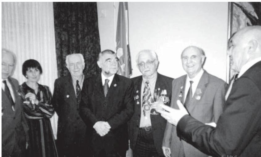
В посольстве Республики Хорватия. Слева направо: Драгиша Дуймович, Горана Бутурович, Иванко Щепанович, Президент Хорватии Степан Месич, Милан Деспот, Анте Мишкич. Москва, 2005 г.