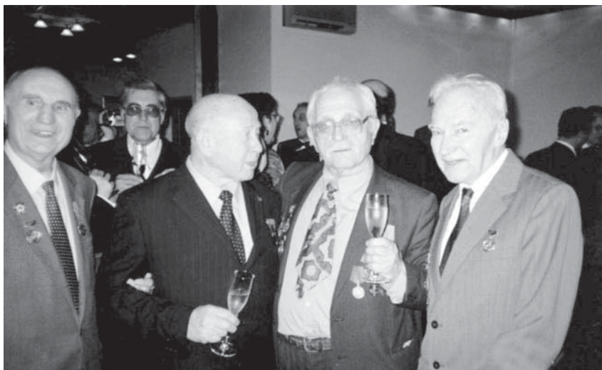
Слева направо: Анте Мишкич, летчик-космонавт Алексей Леонов, Милан Деспот, Драгиша Дуймович. Москва, 2005 г.