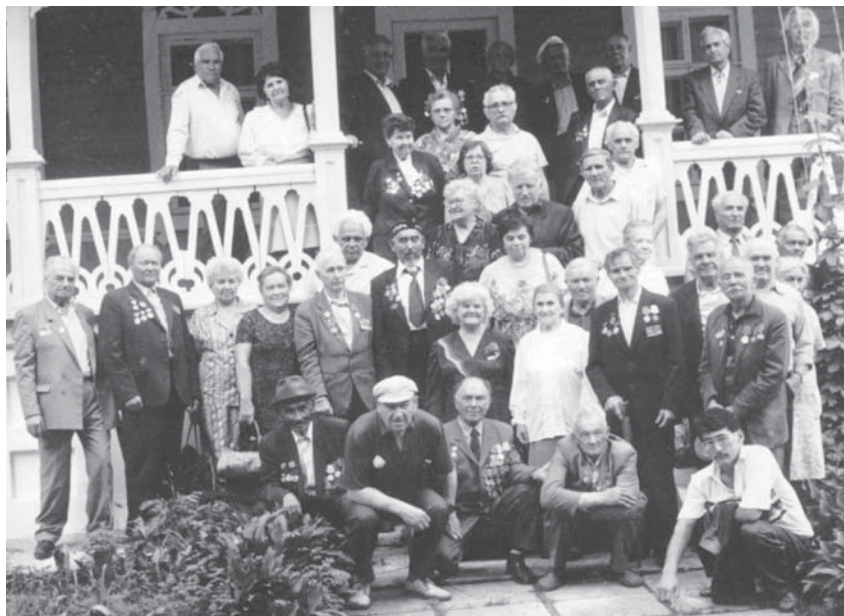
Встреча партизан-интернационалистов в мае 1995 года в г. Орле. (В усадьбе И. Тургенева «Спасское-Лутовиново»)