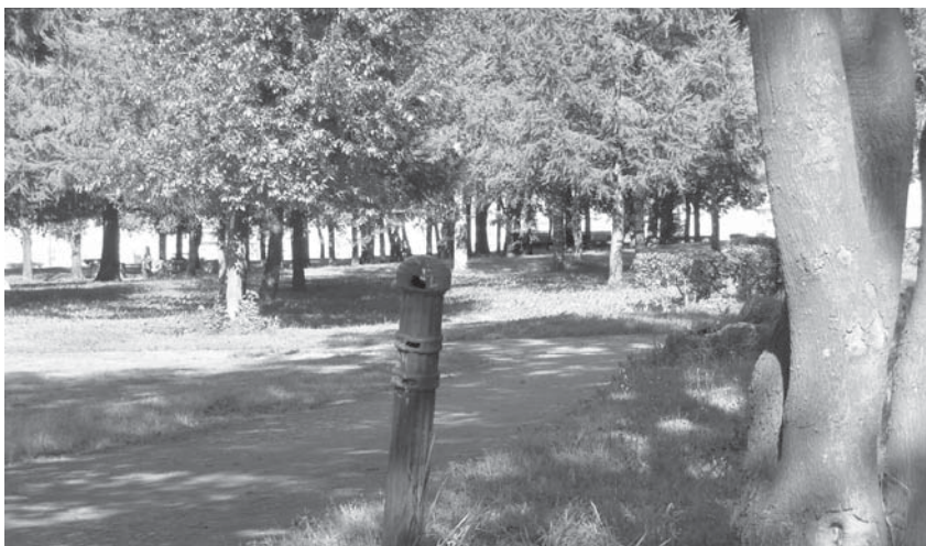
Стойка водопроводной колонки на бывшем Чесноковом переулке, а ныне – одной из дорожек Куракиной дачи. Фото 2009 г.

за разновидность, но она сильно отличается от берез, которые я когда-либо видела. Крона этой березы более плотная, нет повислых ветвей и листва темнее.