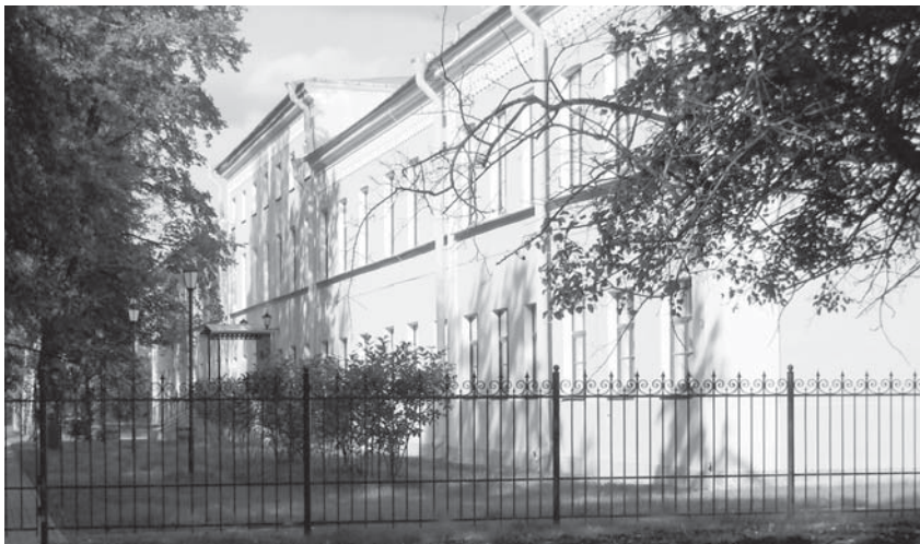
Школа № 328 – бывшее здание Малолетнего отделения Николаевского сиротского института на Куракиной даче

В описании 1880 года говорится, что с западной и северной стороны Александровской дачи протекает Козлов ручей, высыхающий летом.