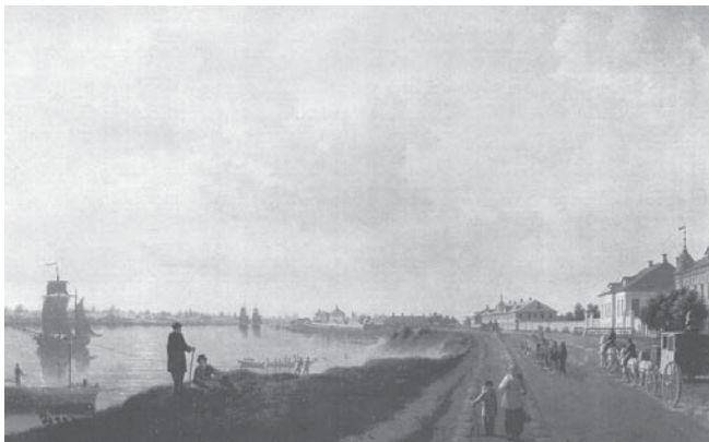
Окраина Петербурга у Фарфорового завода. Б. Патерсен. Эрмитаж. 1793 г.