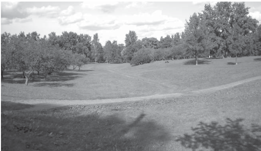
Участок высохшего русла Козлова ручья на Куракиной даче. 2009 г.

Много позже, через 70 лет, на карте 1864 года здесь показано село Фарфоровое, дома которого рас-