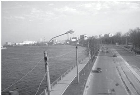
Современная панорама тех же мест. Фото 2009 г.

полагались, как это было принято в русских селениях, вдоль дороги 3 .