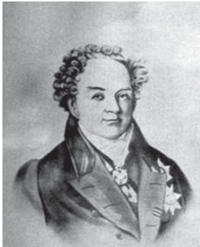
Князь Алексей Борисович Куракин (1759–1829)

Александровская мануфактура получила эту дополнительную дачу под названием Куракиной, так за ней и укрепилось это название.