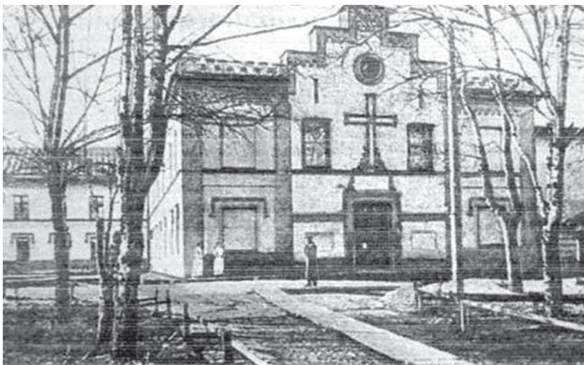
Церковь Святого благоверного князя Александра Невского на Куракиной даче