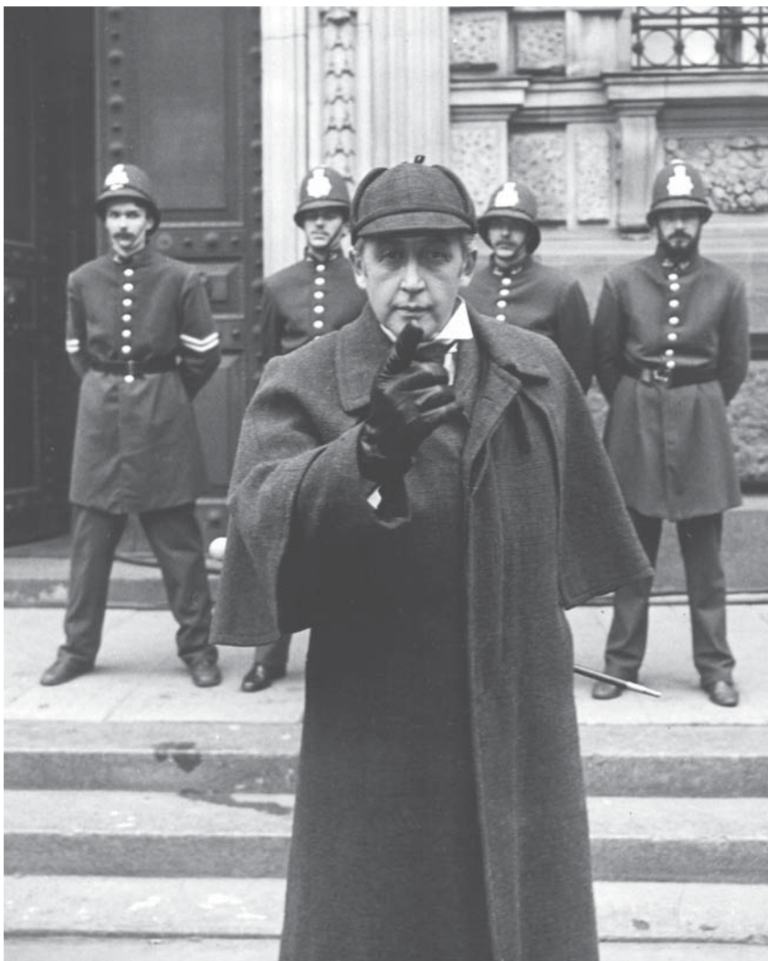
Съемка одного из фильмов о Холмсе по заказу Центрального телевидения в Ленинграде возле Мухинского училища. 1979 г.

Мы старались... И были замечены... Однажды меня послали на фестиваль телесериалов в маленький курортный тосканский городок Кьянчано-Терме, где один дотошный