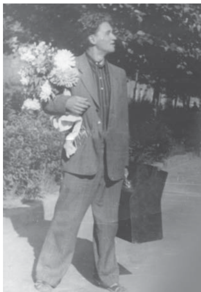
Еще один шаг – и я редактор молодежных и спортивных передач АСТ. 1956 г.

Как выпускник газетного отделения филфака я стал работать