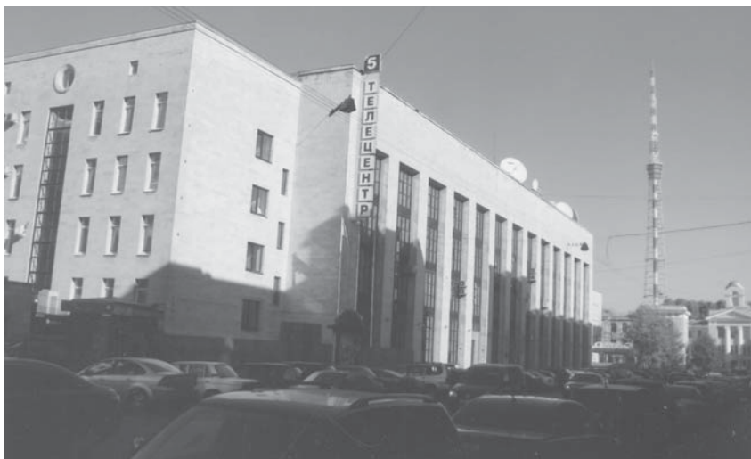
В 1964 году из Первого павильона нового здания телецентра на улице Чапыгина был показан ленинградский «Голубой огонек». А вскоре невдалеке выросла и эта телебашня

Я учился в Ленинградском университете на филологическом фа-