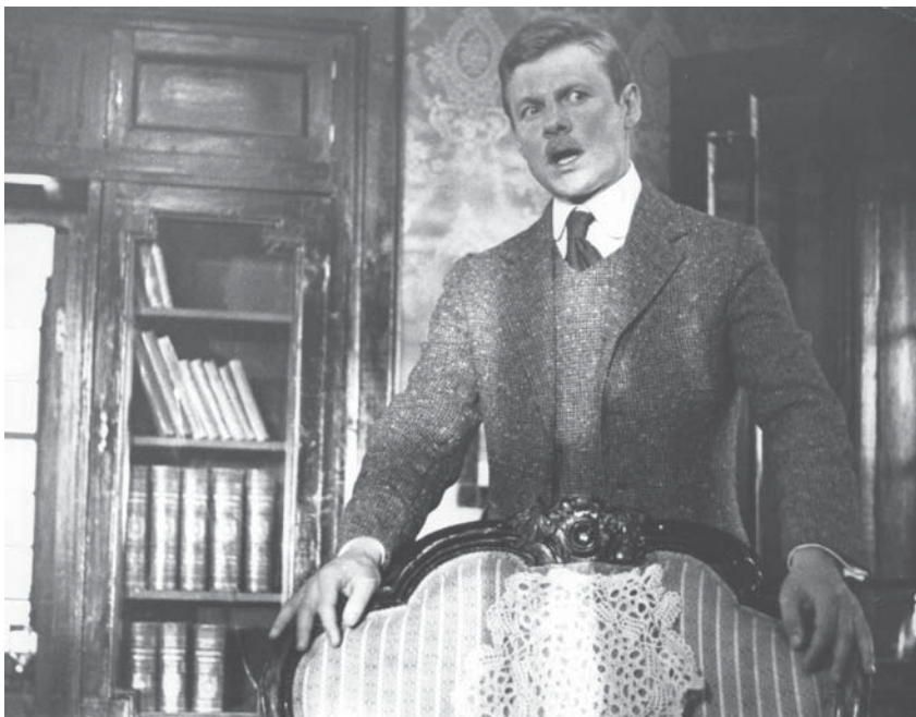
Угадали – это замечательный Виталий Соломин в роли доктора Ватсона