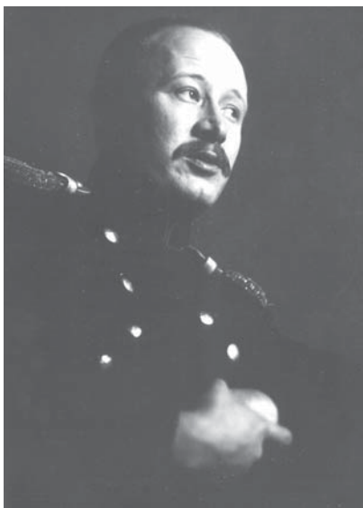
Виктор Проскурин в роли Германна в телефильме по заказу Центрального телевидения «Пиковая дама». 1982 г.

Ничуть не бывало! Одна болезнь сражалась в моей душе с другой заразой.