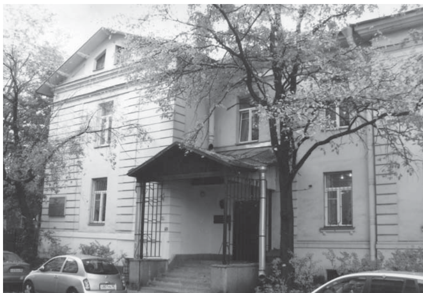
В этом домике на улице академика Павлова в 1938 году родилось Ленинградское телевидение