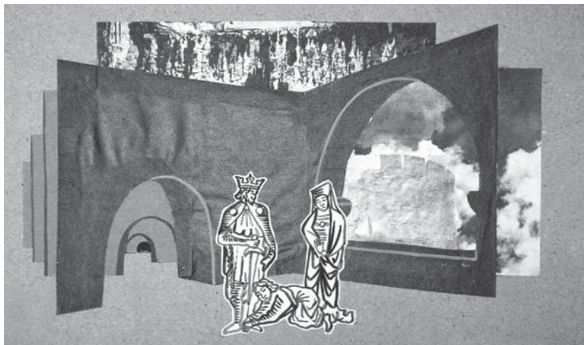
Эскизы декораций к телеспектаклю «Макбет» режиссера Давида Карасика. 1962 г.

Николай Николаевич был душой человек. Спортивный, подтянутый,