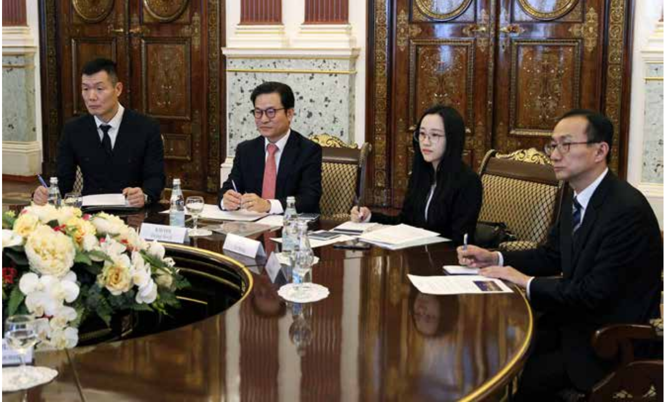
Вячеслав Макаров встретился с Генеральным консулом Республики Корея в Санкт-Петербурге 08.02.2019