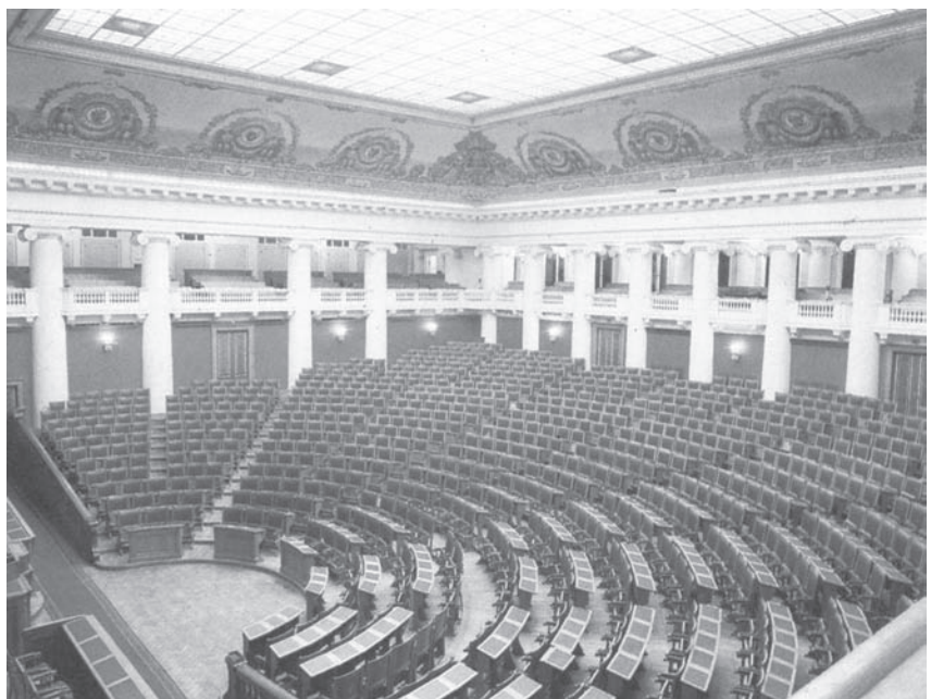
Зал заседаний Таврического дворца

Их квартира была в бельэтаже, и до наших дней сохранился балкон, с которого Зинаида Гиппиус смотрела на Таврический сад и дворец. «Мы следили за событиями по минутам, — мы жили у самой решетки парка в бельэтаже последнего дома одной из улиц, ведущих ко дворцу. Все шесть лет — шесть веков — я смотрела из окна или с балкона то налево, как закатывается солнце в туманном далеке прямой ули-