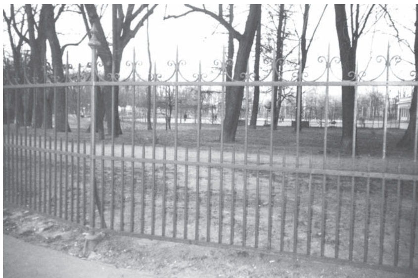
Ограда Таврического сада.

стыдный. В типе “стрюцкого” совмещаются представители разных званий и профессий — канцеляристы, писаря, конторщики, выгнанные со службы, промотавшиеся и опустившиеся “благородные человеки”, с засаленными цветными околышками на фуражках, прогоревшие дотла купчики и тому подобный пропавший, праздничный, бродячий люд. Люд этот во множестве гнездится на петербургских окраинах и между прочим на Песках, поддерживая коммерцию в местных питейных заведениях и освежаясь на чистом воздухе в Таврическом саду. Соответствующего качества и прекрасный пол водит компанию, выпивает “по маленькой” и обменивается нежностями со “стрючками” Таврического сада. Только по воскресным дням выплывает сюда иное наивное песковское купеческое семейство в