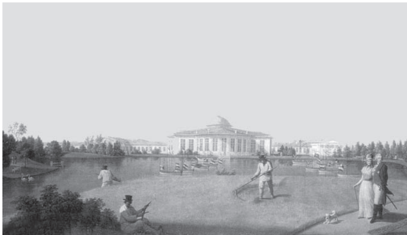
Таврический дворец со стороны сада. Б. Патерсен (до 1797 г.). Холст, масло

Восстановление сада не принесло сколько-нибудь существенных изменений и не повлияло на его планировку; в тот период был проведен ремонт северо-западной части, восста-