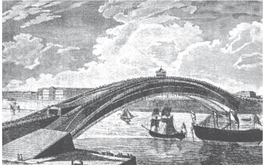
Проект Кулибина одноарочного деревянного моста через Неву. С гравюры 1799 г.

либина с успехом. Мастер получил от правительства специально вычеканенную медаль на Андреевской ленте, но средств на постройку так и не было выделено, и проект не был осуществлен. Задача, предложенная Лондонским Королевским обществом, была решена, но общество не заметило этого проекта. В 1777 году модель перевезли на «угольный двор» Академии наук (на углу набережной и 7-й линии Васильевского острова). Там она находилась 16 лет. В конце 1793 года по указу Екатерины II от 22 мая 1793 года и под руководством самого Кулибина модель, не разбирая, за 6 дней перевезли в Таврический сад. На большом пруду был устроен насыпной островок (его жалкое подобие можно увидеть и сегодня). На него можно было попасть лишь по двум мостам. Одним из них стала модель Ивана Кулибина. Там она простояла без ремонта много лет и 27 июля 1816 года обрушилась от ветхости.