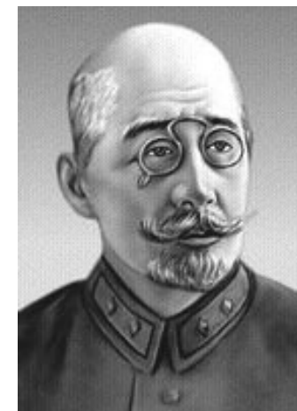
Хирург Сергей Петрович Федоров

Самым знаменитым из проживавших в этом доме был крупнейший хирург профессор Сергей Петрович Фёдоров (1869–1936). Закончил он медицинский факультет Московского университета, в 1900-х гг. стал доцентом, потом профессором Военно-медицинской академии в Петербурге, был одним из первых в России нейрохирургов. Высокой честью и знаком доверия было назначение профессора на должность лейб-хирурга, личного врача императорской семьи. Наблюдал он за тяжело больным царевичем Алексеем. Его отличало серьёзное и уважительное отношение к царскому фавориту Григорию Распутину, доверие к его предсказаниям о состоянии здоровья царевича, к его необъяснимому умению успокоить боли, терзавшие несчастного ребенка.