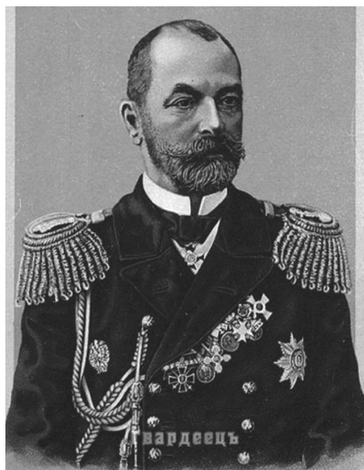
Адмирал Зиновий Петрович Рожественский

после злосчастного поражения русского флота при Цусиме 14-15 мая 1905 г. Адмирала, командовавшего морской эскадрой, объявили виновником поражения, предали военноморскому суду. В доме на Сапёрном пер., 19, капитан 1 ранга З. П. Рожественский жил в 1880-х гг. 15