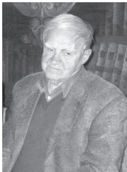
Д. А. Гранин

Д. А. Гранин: — У меня есть любопытство к тому, что происходит в стране у нашего самого ближнего соседа. Я живу летом на Карельском перешейке, часто бываю в Финляндии. Я убедился, что мы хотя живем рядом, разница в нашей жизни – разительная. Она начинается с момента переезда границы. Как переезжаешь границу, так ощущаешь, что ты попал в другую страну. Кроме того, меня поразили те успехи, которых достигли финны в области электроники и