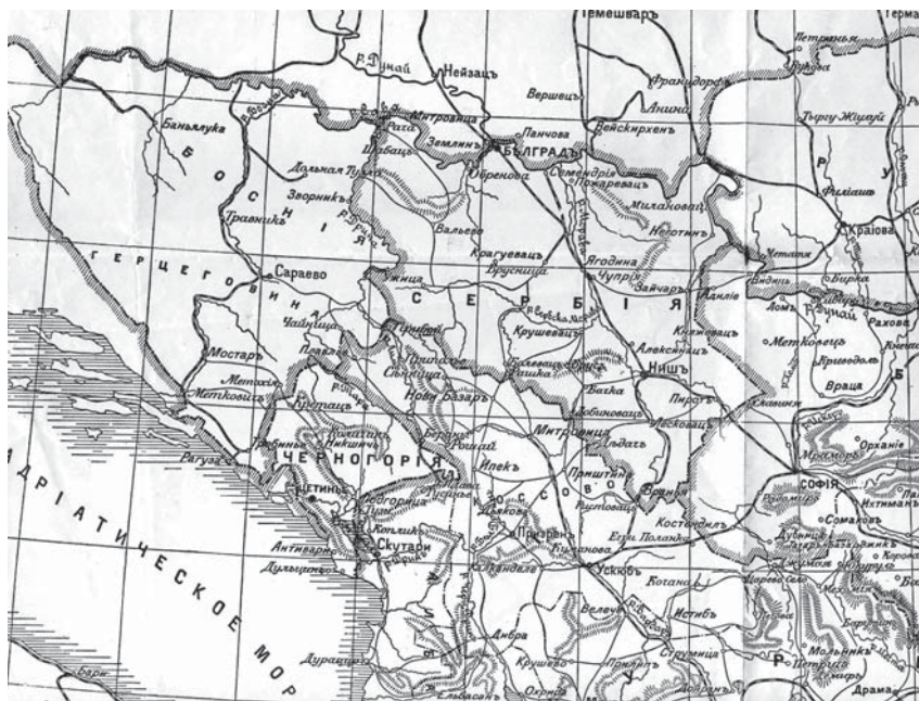
Карта 1914 г.