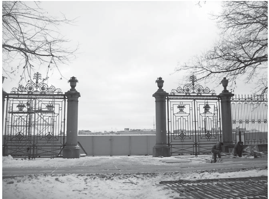
Реставрация Невской ограды. 2009 г.