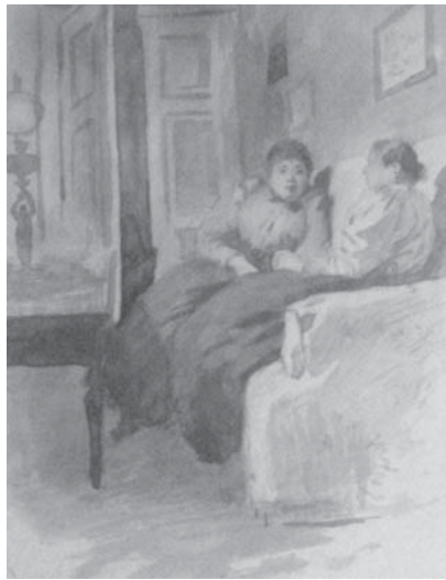
Эскиз, изображающий бытовую сцену

Другой рисунок представляет сидящую в кресле женщину со сложенными на груди руками. Ее фигура оказывается строго по центру рисунка, тонко прорисованное лицо на затемненном фоне задумчиво, на шее видна черная бархотка. Чередование осветленных и затемненных участков создает выразительность, энергичные штрихи карандашом сочетаются с тонкой проработкой. Судя по поставленной дате, рисунок относится к 1900 году.