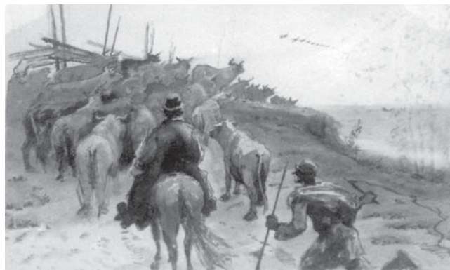
Зарисовки художника, выполненные в смешанной технике