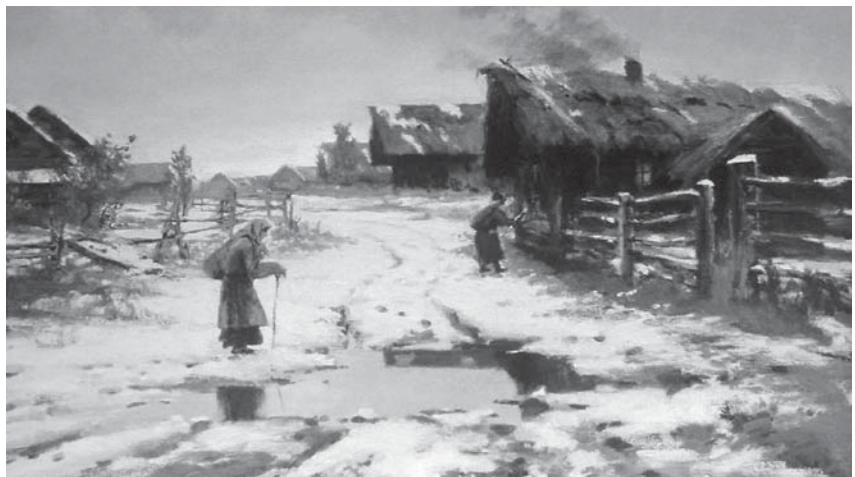
«Вечер в деревне. Оттепель»

Картина Бажина «Вечер в деревне. Оттепель» (1898) находится в Нижнетагильском музее изобразительных искусств. В настоящее время это пока единственная известная картина художника, находящаяся в музее. На полотне представлен деревенский пейзаж, широкая дорога, низкие темные дома. Поздняя осень, когда деревья еще не конца облетели, но уже выпал первый снег. Он уже тает, образуя глубокие лужи. Крестьянка с котомкой за плечами, опираясь на палку, пытается перейти размокшую дорогу. Далее виднеется еще фигура крестьянина. Особенно художнику удается передать снег, наполненный множеством оттенков от темно-синих и сероватых до прозрачных тонов. В картине преобладают синеватые, плотные коричневые и серые цвета, оживленные сполохами теплых пятен. Уходящая вдаль, петляющая дорога уведит взгляд вглубь полотна. Покосившаяся кое-где ограда свидетельствует о бедности и запустении. Художнику удается создать ощущение холодного дня, размокшей дороги, приближения зимы, низкое небо придает всему пейзажу сумрачность.