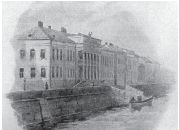
«Дворцы на набережной Невы»

спокойная вода. Композиция построена таким образом, что посредине оказывается классический строгий портик, художник подмечает главное в облике города – четкость и стройность его зданий.