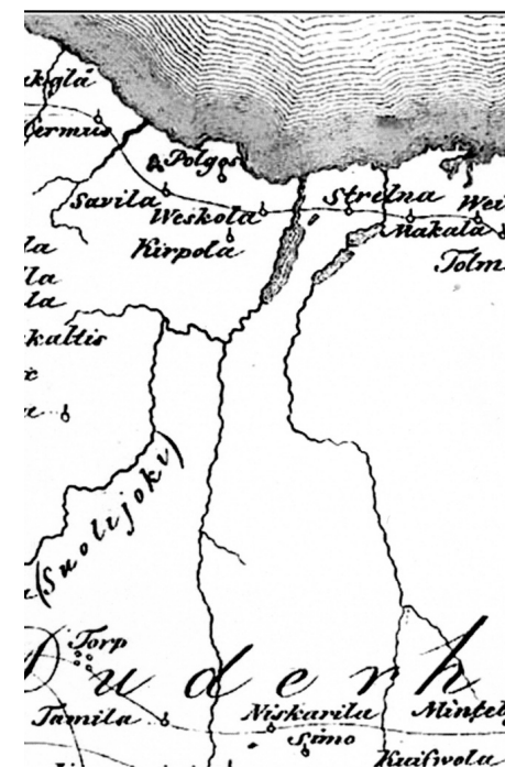
Фрагмент «Карты бывших губерний Иван-города, Яма, Копорья, Нэтеборга, показывающей разделение и состояние этого края в 1676 году»

В качестве примера опишем одну из волостей «в Ореховском уезде, в Ижерском погосте волость в Калганицах на усть Невы в Поморье». Сегодня это южный и северный берега Финского залива от устья Невы до Петродворца и Лахты. В волости было в конце XV века 60 деревень (среди них — две деревни Телтеницы, превратившиеся, после «присоединения», в пустоши Большой и Малый Тельтнис, а в XVIII веке — в деревню Тентелеву), а дохода (оброка) с этой волости шло: более 40 баранов, 32 полти мяса, 3 борова, 625 сига, 15 сыров, 50 блюд и