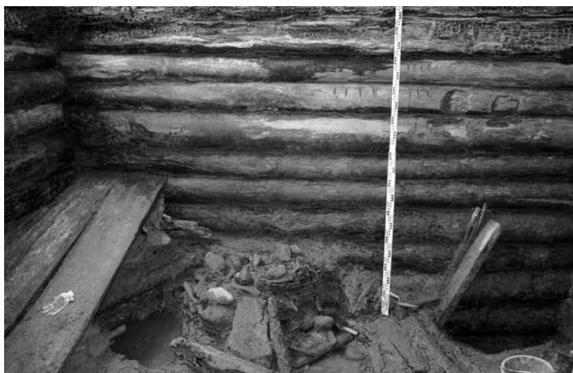
Деревянная башня-донжон Ландскроны, 1300 г. Законсервирована на месте. Раскопки 2006–2009 гг.