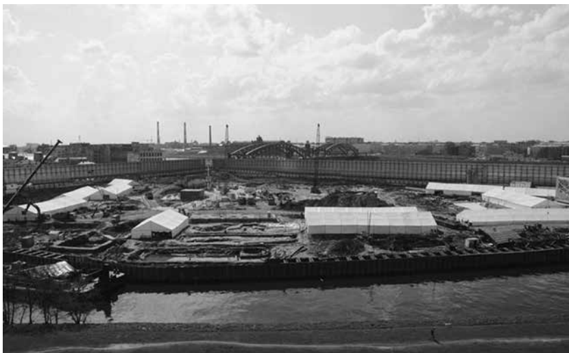
Археологічні розкопки на території Охтинського мису