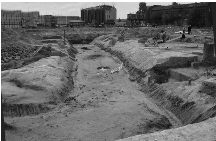
Ров Ландскроны. 1300 г. Раскопки 2006–2009 гг.