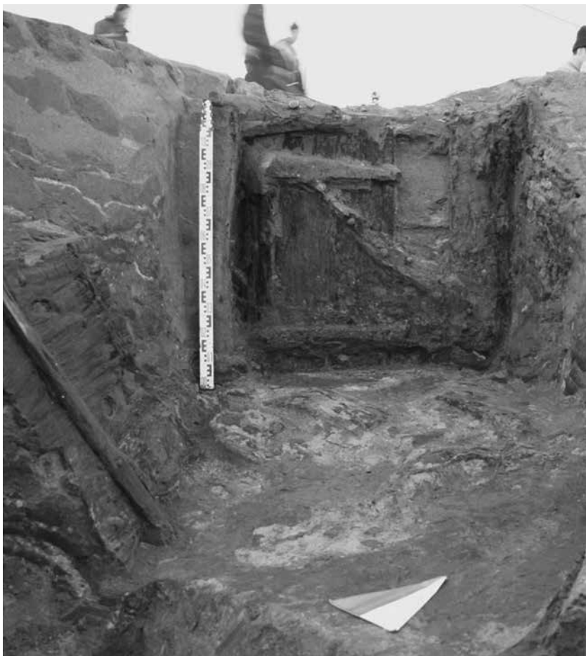
Потайная дверь Мертвого бастиона крепости Ниенинци, Раскопки 2006–2009 гг.