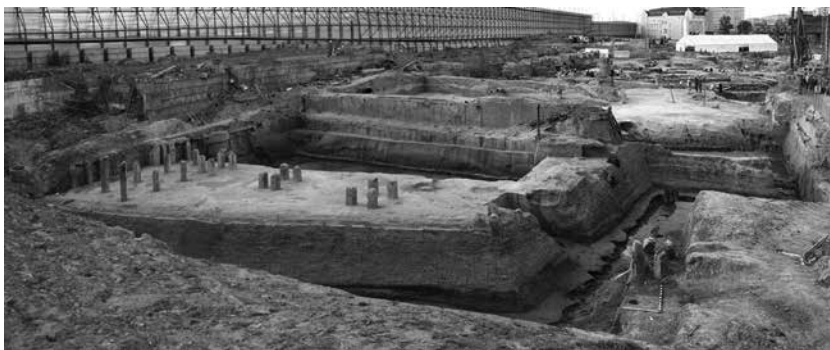
Гельфельтов бастион Ниеншанца. Розкопки 2006–2009 гг.