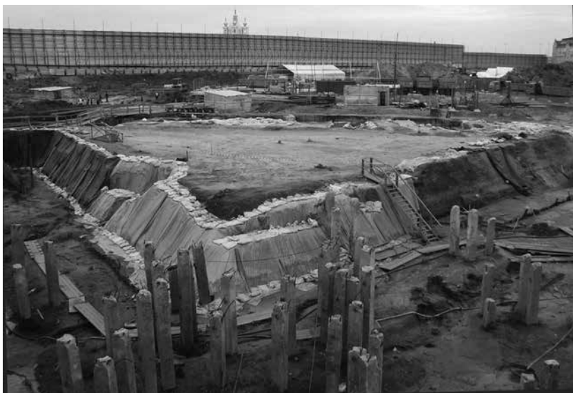
Карлов бастион Ниеншанца. Раскопки 2006–2009 гг.