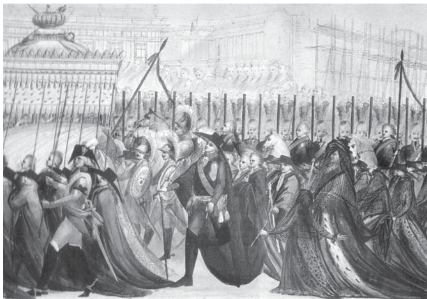
Печальная процессия перенесения праха Петра III из Александро-Невского монастыря в Зимний дворец 2 декабря 1796 г. Неизвестный художник. Фрагмент. Императорская семья следует за катафалком Петра III

Как только умерла Екатерина II, Павел I повелел «художникам Теремным» (Термен) исполнить ответственный заказ – создать золотые траурные короны 27 , за изготовление которых ювелиры получили 5200 рублей 28 . Одна из корон, предназначенная для Петра III, была отвезена Павлом Петровичем в Александро-Невский монастырь 25 ноября, другая в тот же день была возложена Марией Федоровной на голову свекрови перед переложением тела Екатерины II в гроб и перенесением в Castrum Doloris . Естественно, ни о каком поднятии тела до вертикального положения и о мифической посмертной коронации правившей и уже коронованной императрицы речь не шла, так как имело место точное следование установленному церемониалу императорских похорон. То, что было неотъемлемой частью ритуала, стало восприниматься людьми, не знакомыми с церемониалом, как «совместное коронование» или «сокоронование» 29 . Для того чтобы дать ответ на вопрос о том, возможно ли посмертное, да еще и совместное коронование, следует остановиться на особенности коронации российских правителей. Собственно коронация ничего не добавляет к титулу монарха, правление которого начинается с принятия присяги подданных. Само коронационное торжество, проводимое через какое-то время после вступления