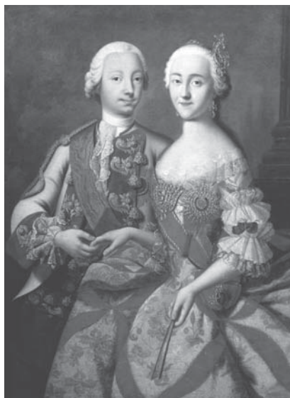
Портрет Петра III и Екатерины II