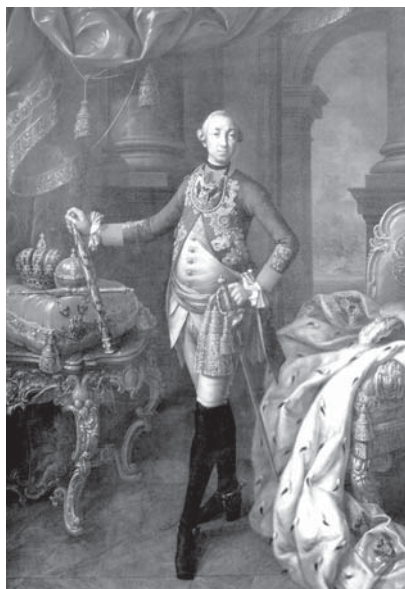
А. П. Антропов. Портрет императора Петра III. 1762 г.

19 ноября произошло событие, давшее повод для слухов и сплетен на века. По Летописи Александро-Невской лавры: «1796 года Ноября 19-го числа, повелением благоче-