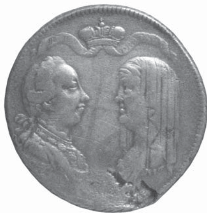
Памятная медаль на совместное погребение Петра III и Екатерины II