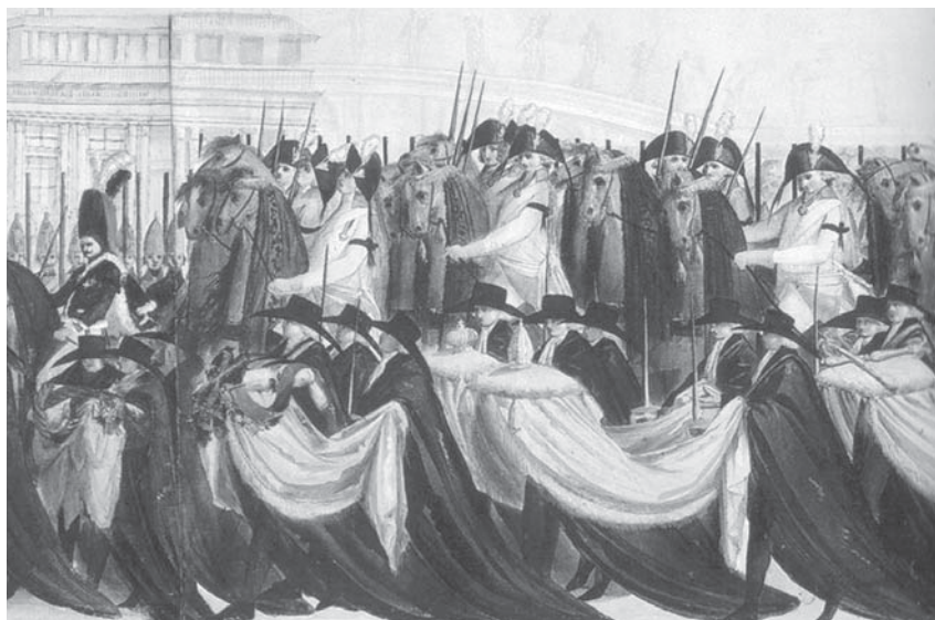
Печальная процессия перенесения праха Петра III из Александро-Невского монастыря в Зимний дворец 2 декабря 1796 г. Неизвестный художник. Фрагмент. Отделение регалий

сплотить семью вокруг ее главы являлась подготовкой к тому, что было сделано в день его коронации 5 апреля 1797 года, когда монарх через серию законодательных актов определил все аспекты взаимоотношений членов императорской фамилии 20 . Не мифический «масонский» ритуал 21 , а установление нового династического сценария, когда не единоличный государь представляет власть верховную и держит в страхе своих близких, выбирая по своему произволу себе наследника, а целая императорская семья, в которой все роли расписаны, управляет государством, подчиняясь своему главе и демонстрируя пример подданным. Умысел человеческий не может вторгаться в промысел Божий, вот что важно было продемонстрировать в момент соединения императорской семьи у гроба Петра III. Для поддержания этой высокой идеи требовалось восстановление справедливости относительно незаслуженно обиженного предшественника, особенно, если им был собственный отец. Поэтому-то, как представляется, было продумано заранее и реализовано то действие, которое имело место при эксгумации гроба покойного внука Петра Великого.