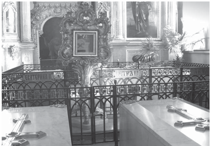
Могилы Екатерины II и Петра III в Петропавловском соборе

Нынешний год богат на юбилеи. В 2013 году исполняется 400 лет с начала правления династии Романовых и 300 лет Александро-Невской лавре. События, описанные в этой работе, логически связаны с историей династии и лавры. Династии Романовых как правящей семьи уже не существует, хотя живы их потомки, но возрождается и усиливается святыня нашего города Александро-Невская лавра – один из главных духовных центров всей нашей страны.