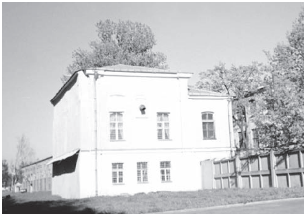
Анастасиевская богадельня Тарасовых сегодня. Партизанская ул., 13. Фото 2001 г.