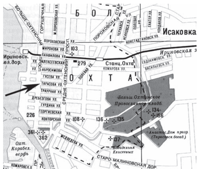
Большая Охта в 1912 г. Фрагмент карты «Храмы Санкт-Петербурга: 1912 г.» (СПб., 1994)