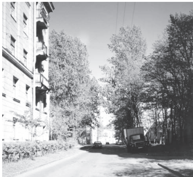
Тарасова улица на Большой Охте. Фото 2001 г.