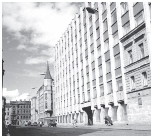
Улица Егорова (бывший Тарасов пер.). Фото 2001 г.