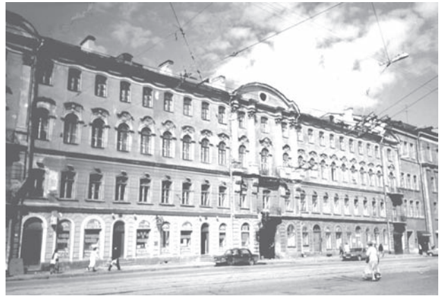
Дом Тарасовых. 1-я Красноармейская ул., д. 3–5. (Арх. К. К. Андерсон, А. И. Ланге и Р. И. Кузьмин, 1858–1859). Фото 1998 г.

Церковь преподобного Алексия, человека Божия, была закрыта в 1923 году и снесена, могилы семьи Тарасовых уничтожены. Здание богадельни частично сохра-