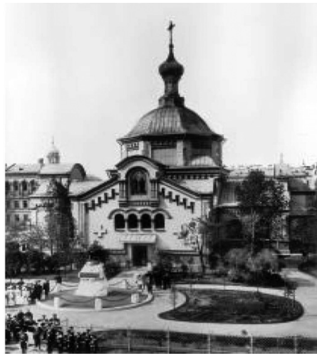
Церковь Космы и Дамиана в день открытия памятника. 1899. К. Булла

В 1891 году для украшения перестроенного храма тому же художнику П. П. Заболоцкому были заказаны 30 картин, изображающих все основные события земной жизни Христа. Заказ был выполнен к 1 ноября 15 1897 года, и храм принял вид «утешающий взор