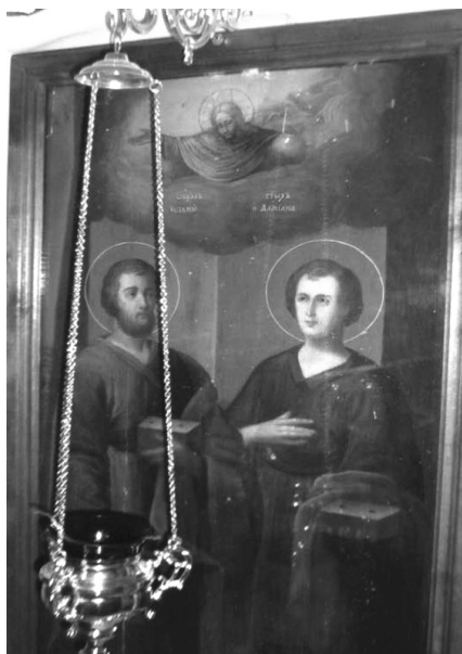
Икона Космы и Дамиана из домового храма больницы № 31 СПб – одна из икон церкви л.-гв. Саперного батальона. Фото 2011 г.

Летом 1885 года началась перестройка здания. Церковь М. Месмахера «...мало походит на наши обыкновенные православные храмы. Она без купола, не высока и имеет вид жилого дома. В настоящее время посреди здания находится пространство, где собственно предполагалось совершать богослужение, а по обеим сторонам его были расположены, на высоте трех ступеней, два открытых зала, выстроенных для манежа и обращенных в церковь...», – сообщала «Нива» о причинах начавшихся работ [12]. «Новое время» дополняло: «...многие, проходя мимо, и не подозревали, что это странное здание среди расчищенной площадки на Знаменской есть церковь. Теперь военный министр утвердил проект наружной перделки, и работы уже начаты. Над крышей храма идет постройка большого купола на железных фермах, соответственно общему виду делаются и некоторые изменения в наружных стенах, пробиваются лишние окна...» [13].