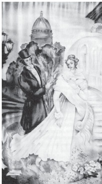
«Я помню чудное мгновенье...». 2007 г.

стоялась летом 1992 года в лектории Русского музея. Неназойливое, но очень точное название ее передавало принципы, суть и глубинный смысл работы семьи художников. А произведения только подтверждали это.