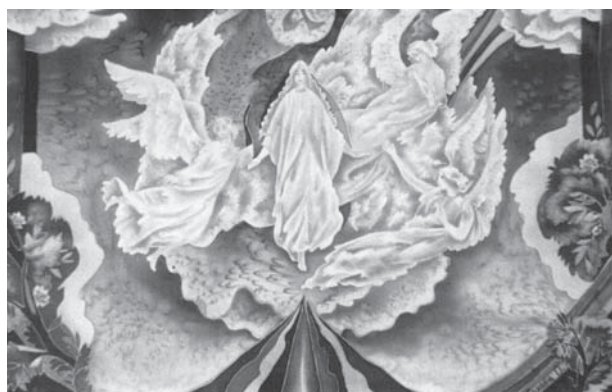
Альфа. 1995 г.