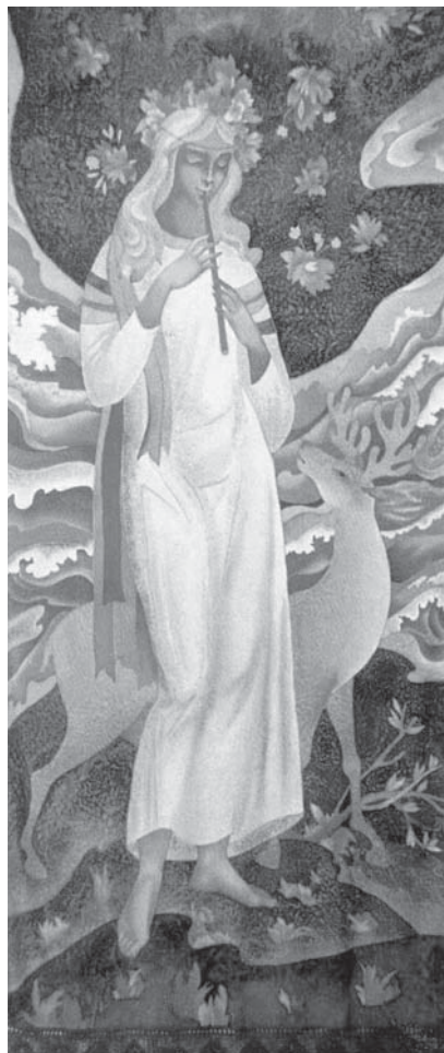
Мелодия Севера. 1990 г.

Но это не физический, а в первую очередь духовный путь. Жизнь Души – в человекоподобной ангельской «плоти». Такой возвышенный религиозно-философский подход стал доступен художнику только с годами накопленного опыта: ведь замысел требовал соответствующей