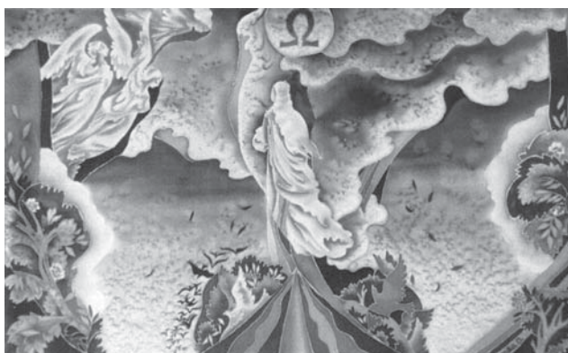
Омега. 1995 г.