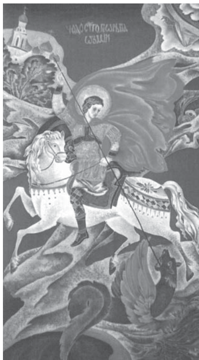
Св. Георгий. 1997 г.