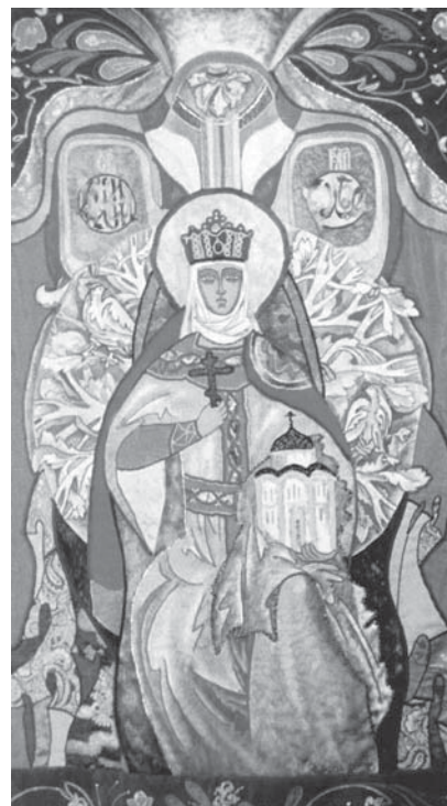
Княгиня Ольга. 1995 г.