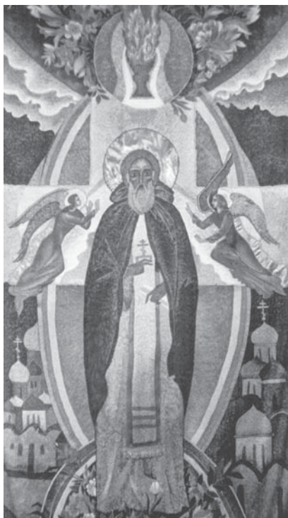
Сергий Радонежский (центральная часть триптиха). 1992 г.