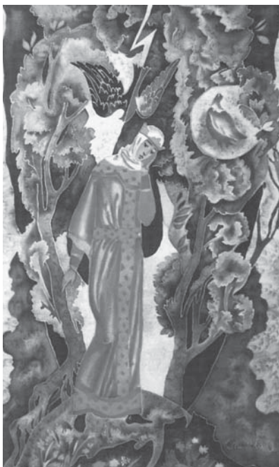
Плач Ольги. 1995 г.