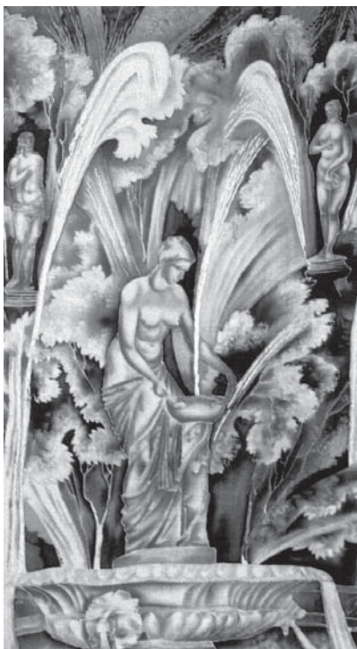
Петродворец. Фонтан «Нимфа». 2000 г.