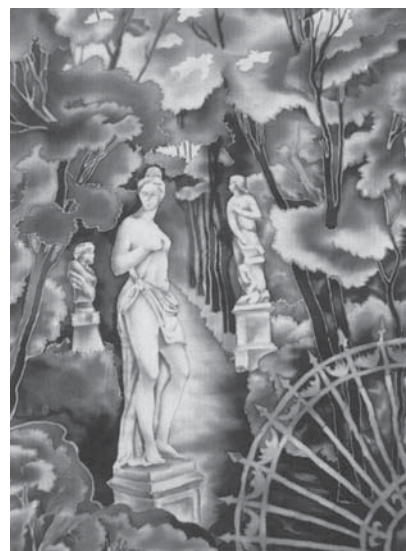
Летний сад. 1996 г.