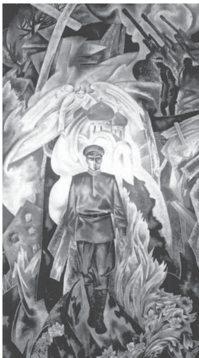
Священная война (Памяти отца). 2005 г.