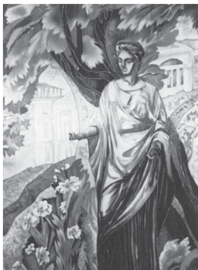
Павловск. Флора. 2000 г.