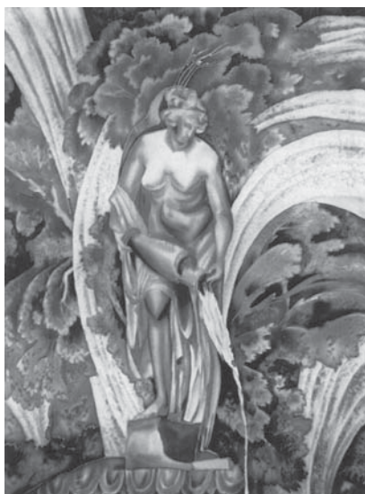
Петродворец. Фонтан Данаида. 2000 г.