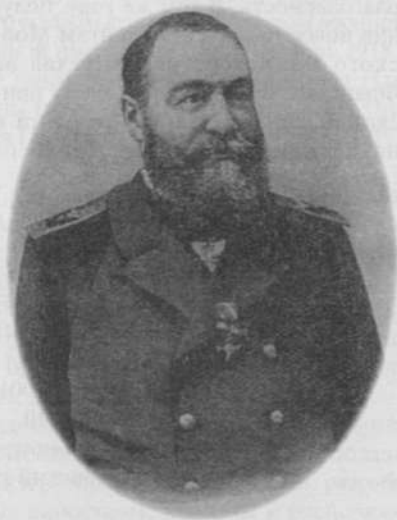
Е. И. Алексеев, главный начальник Квантунской области и морских сил в Тихом океане. 1899–1900 гг.

(1843–1918) в тринадцать лет поступил в Морской кадетский корпус. Выпущенный в 1863 г. гардемарин, двадцатилетний юноша на корвете «Варяг» ушел в свое первое кругосветное плавание. Суровые будни океанского плавания под командой опытного моряка командира фрегата капитана 2-го ранга Лунда дали свои первые результаты. В 1865 г., успешно выдержав экзамен, Е. И. Алексеев был произведен в мичманы, а по возвращении из плавания (30 июня 1867 г.) – в лейтенанты.