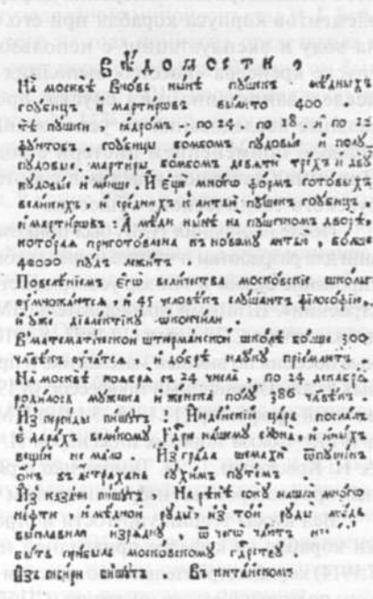
Фрагменты газеты «Ведомости» (1705 г.)